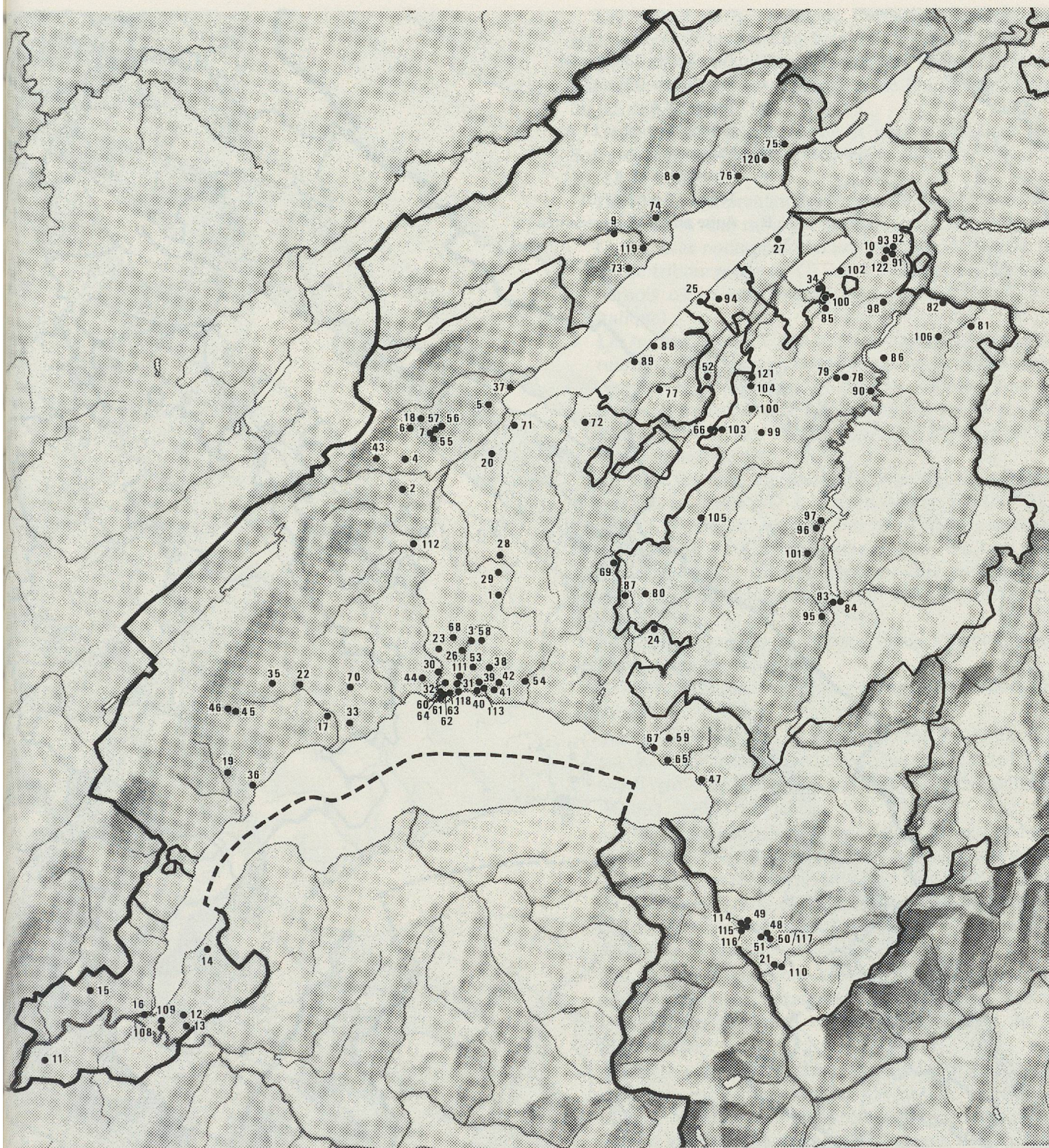
Fig. 112. Carte de répartition des tombes La Tène dans la zone d'étude. (Les N os 1-122 correspondent aux numéros d'ordre du corpus; voir Index 1.) Ech. 1:600 000.