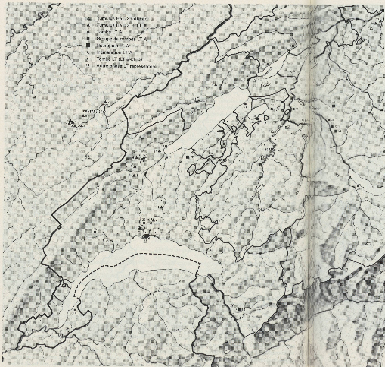
Fig. 113. Carte de répartition des tumuli Ha D3, tombes secondaires LT A en tumulus et tombes plates LT A dans la zone d'étude (élargie à la région de Pontarlier et au canton de Berne: en italique). Ech. 1:600 000.

Les tumuli de la région de Pontarlier forment un groupe bien net au nord du Jura (N os 1-7 en italique).