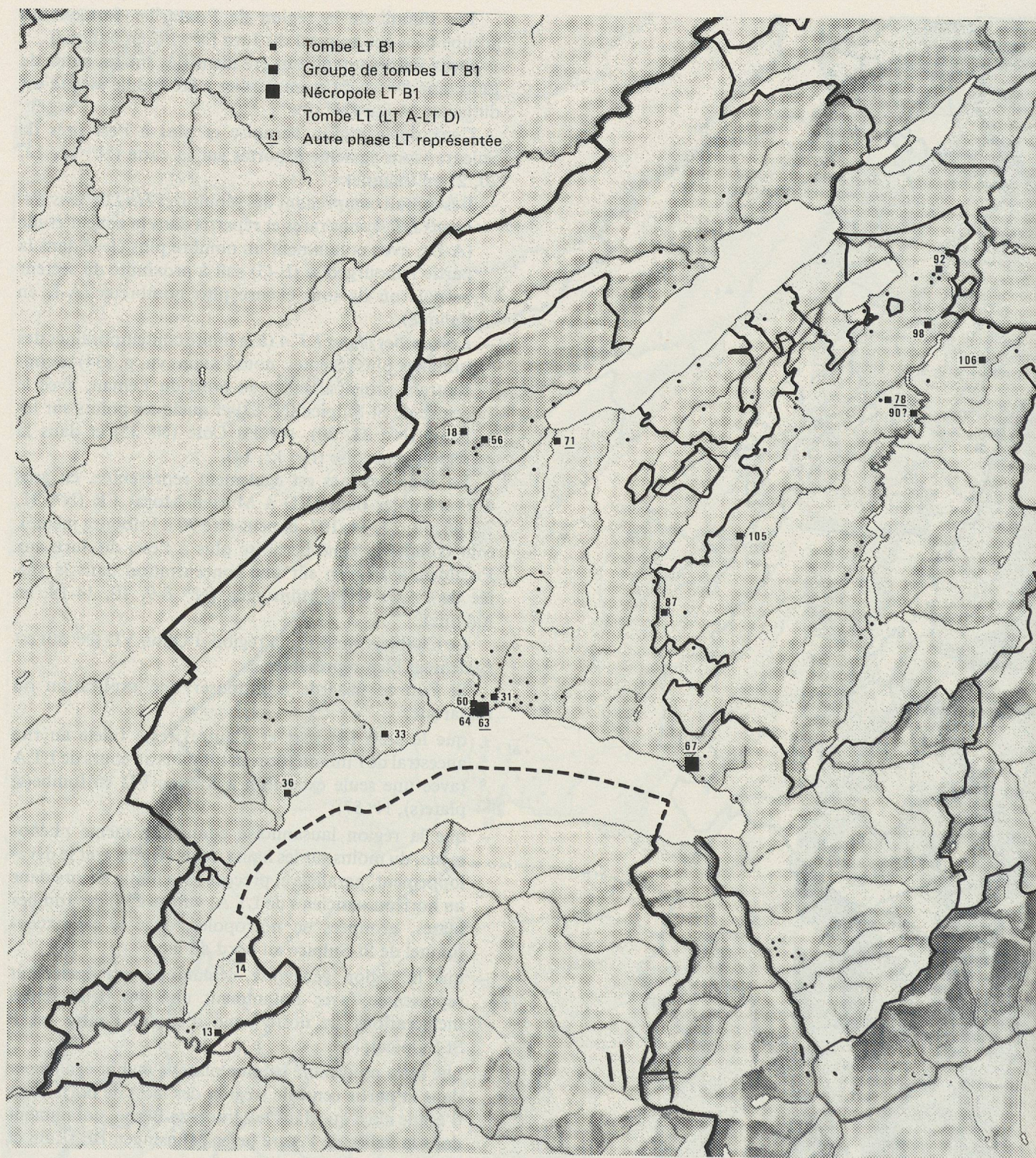
Fig. 114. Carte de répartition des tombes LT B1 dans la zone d'étude. Ech. 1:600 000.