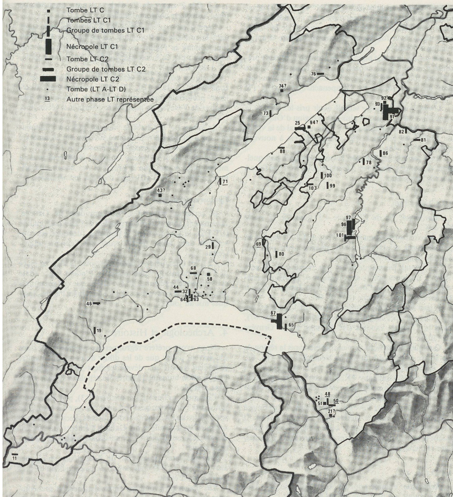
Fig. 116. Carte de répartition des tombes LT C (LT C1 + LT C2) dans la zone d'étude. Ech. 1:600 000.