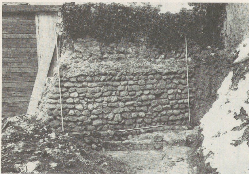
Fig.41. Zone A: segment du mur d'enceinte du XIII e siècle prenant assise sur les vestiges de la domus .

Seuls quelques rares vestiges isolés de constructions légères (403 et 404) utilisant les vestiges architecturaux romains, implantées dans la couche de démolition de l' insula , peuvent signaler une fréquentation du site entre l'époque romaine et le Moyen Age.