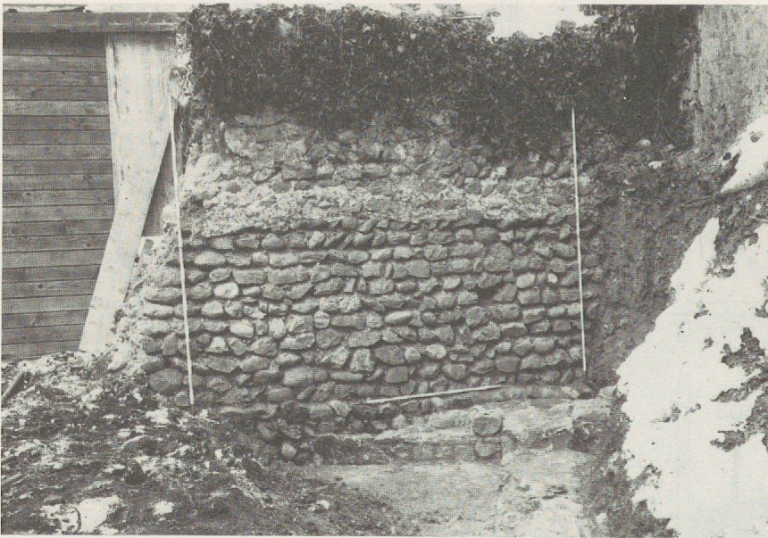
Fig.41. Zone A: segment du mur d'enceinte du XIII e siècle prenant assise sur les vestiges de la domus .

Seuls quelques rares vestiges isolés de constructions légères (403 et 404) utilisant les vestiges architecturaux romains, implantées dans la couche de démolition de l' insula , peuvent signaler une fréquentation du site entre l'époque romaine et le Moyen Age.