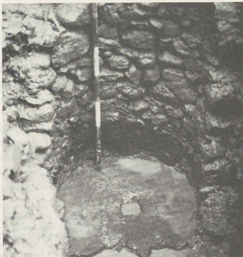
Fig.43. Zone B: Fond du puits médiéval 402 avec rouet de pierre.