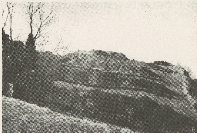
Fig. 2 St-Triphon, Le Lessus. Chantier C/1972. Vue du nord-est. Tranchées E (au premier plan) à B (voir fig. 12).

profil, avaient été emportés par la machine avant l'intervention des archéologues ( chantier A );