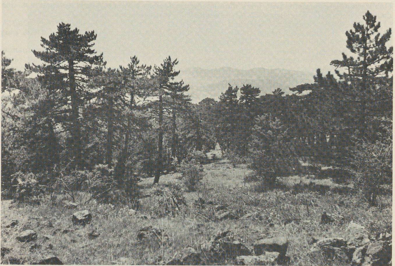
Fig. 2. Forêt de pins sur la route du Türkmen Dağ.

avaient été signalés. C'est ainsi qu'ils découvrirent le Monument de Midas (fig. 1), la grande façade appelée ainsi dès le début d'après le nom d'un roi Midas, qui se lit dans une des deux inscriptions phrygiennes 8 . Etant obligé de repartir presque aussitôt, Leake exhorte les futurs voyageurs qui passeraient par là à consacrer un jour ou deux à l'observation plus complète de ce monument. Mais si, après la publication du compte rendu de Leake, ceux-ci viennent en effet, ils sont d'habitude pressés; on se demande pourquoi. Ce fut le mérite de l'Institut Français d'Istanbul, après des sondages en 1936, d'entamer la fouille de la Cité de Midas, — exécutée de 1937 à 1939 9 , — fouille dont certains des voyageurs du XIX e siècle avaient déjà depuis longtemps souligné la nécessité 10 .