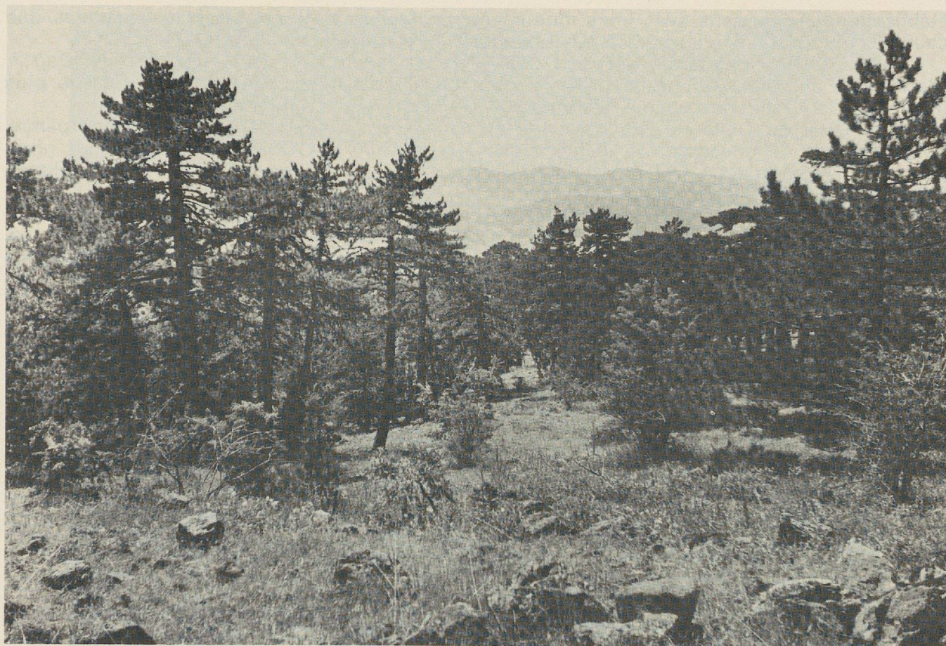
Fig. 2. Forêt de pins sur la route du Türkmen Dağ.

avaient été signalés. C'est ainsi qu'ils découvrirent le Monument de Midas (fig. 1), la grande façade appelée ainsi dès le début d'après le nom d'un roi Midas, qui se lit dans une des deux inscriptions phrygiennes 8 . Etant obligé de repartir presque aussitôt, Leake exhorte les futurs voyageurs qui passeraient par là à consacrer un jour ou deux à l'observation plus complète de ce monument. Mais si, après la publication du compte rendu de Leake, ceux-ci viennent en effet, ils sont d'habitude pressés; on se demande pourquoi. Ce fut le mérite de l'Institut Français d'Istanbul, après des sondages en 1936, d'entamer la fouille de la Cité de Midas, — exécutée de 1937 à 1939 9 , — fouille dont certains des voyageurs du XIX e siècle avaient déjà depuis longtemps souligné la nécessité 10 .