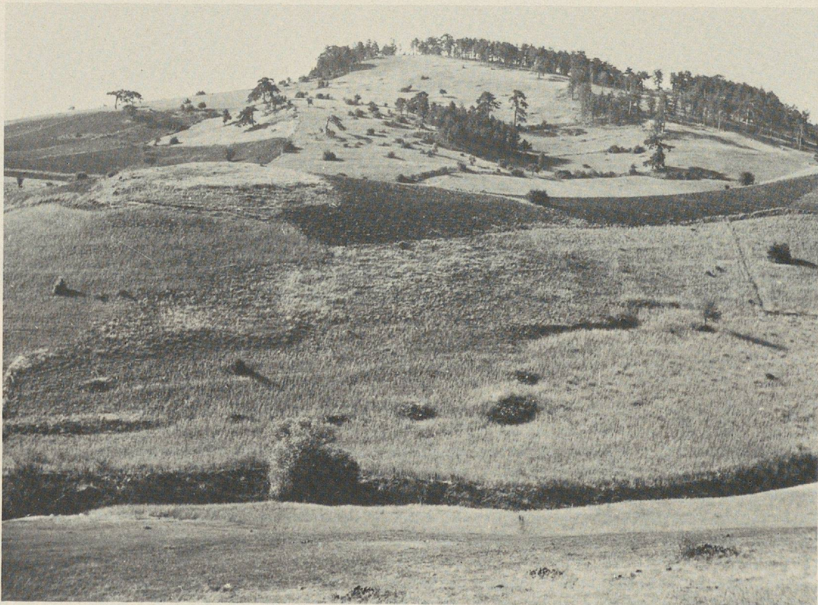
Fig. 3. Au centre du Türkmen Dağ, entre les villages de Güllü Dere et d'Ildris Yaylası.

Plus à l'est on atteint le véritable centre, avec des terres arables (fig. 3). On y respire l'air frais des hautes terres, d'où la vue s'étend tout alentour des steppes de l'Anatolie. Pour ma part j'étais saisie, en outre, par la joie de la découverte, — de m'arrêter ainsi dans des contrées inconnues, non explorées, — hors du sillage de tout prédécesseur.