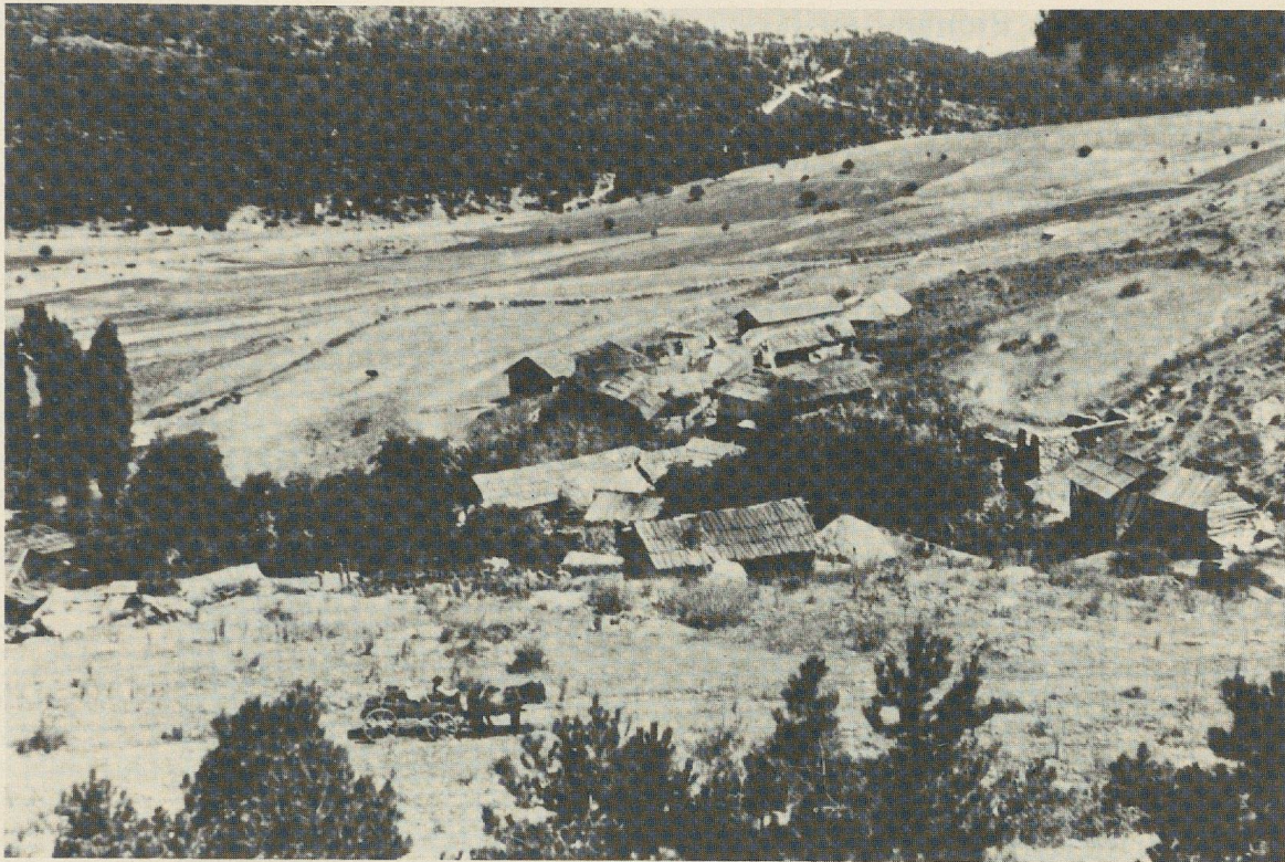
Fig. 4. Village d'Ildris Yaylası.

A l'ouest, par où nous sommes montés, il y a sur le Türkmen Baba, le sommet le plus élevé, un sanctuaire de la Mère des dieux (connue en cette période sous le nom d'Agdistis dans la périphérie). Des dédicaces gisaient sur le sol, ou se trouvaient insérées parmi les blocs qui signalent le tombeau du Türkmen Baba, un saint musulman maintenant inconnu, dont doit dériver le nom du sommet; je trouvai encore quelques dédicaces, provenant de ce sanctuaire, — l'une d'elles au dieu Hosios associé à la Mère, — dans le petit village de Güllü Dere, sur le versant du Türkmen Baba. D'habitude, ces pierres votives portent des vœux en faveur des enfants du dédicant; il y a encore d'autres dédicaces à la Mère des dieux, mais elles sont toutes concentrées au nord-ouest de la montagne 13 .