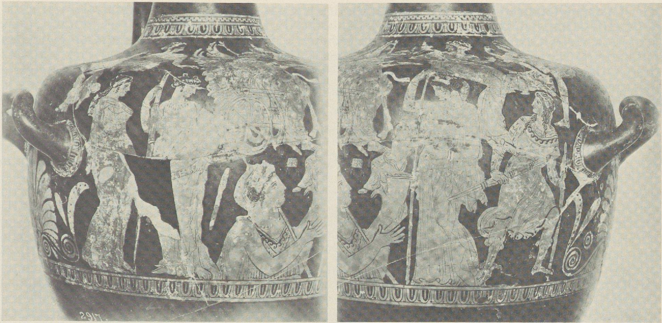
Fig. 4 a et b: Hydrie du musée d'Istanbul.