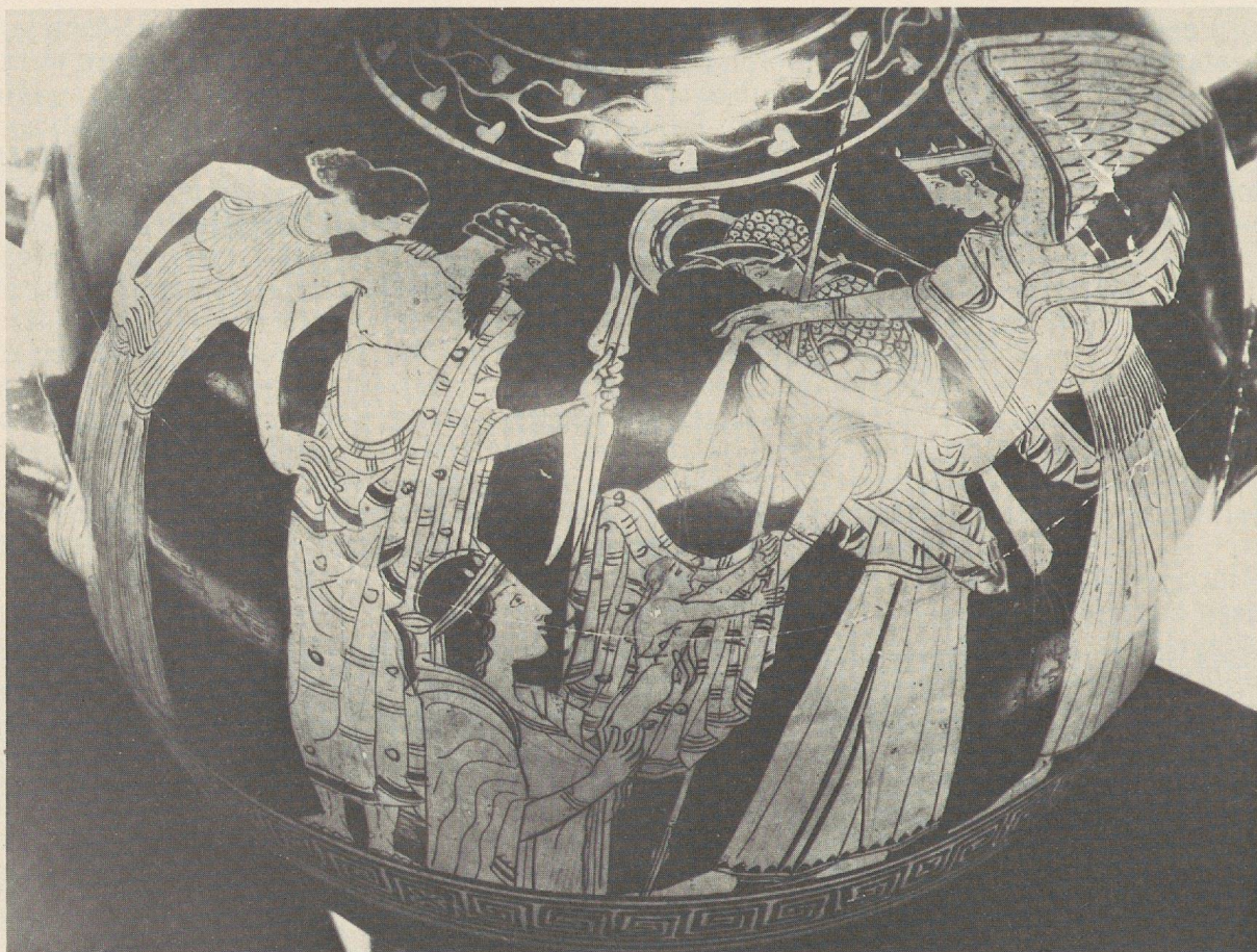
Fig. 1 : Hydrie du British Museum.

calice de Chiusi au musée de Palerme (fig. 3) 9 , où les protagonistes se trouvent accostés de deux Nikés, le cratère en cloche incomplet du Peintre de Pronomos à Olynthe 10 et un fragment de relief en marbre du Vatican 11 . C'est au IV e siècle, sans plus de précision, que l'on rapportera un relief mutilé de l'ancienne collection Albani au Louvre 12 . Les numismates datent, d'une manière assez générale, de la seconde moitié du V e siècle des statères de Cyzique offrant, entre autres motifs empruntés à l'imagerie athénienne, celui de la déesse qui élève dans ses bras un jeune enfant ou celle de Cécrops anguipède tenant en main un rameau d'olivier 13 .