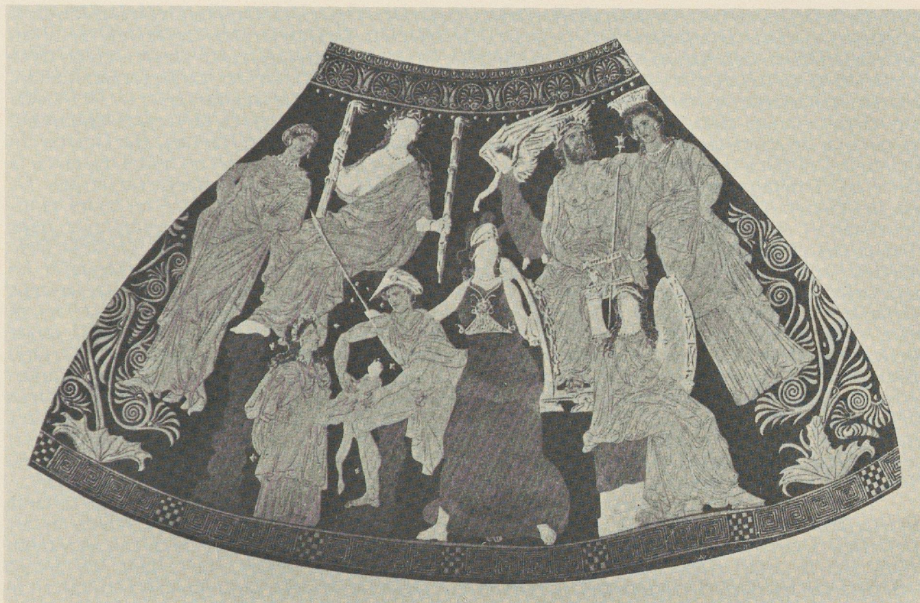
Fig. 5: Péliké du musée de l'Ermitage.