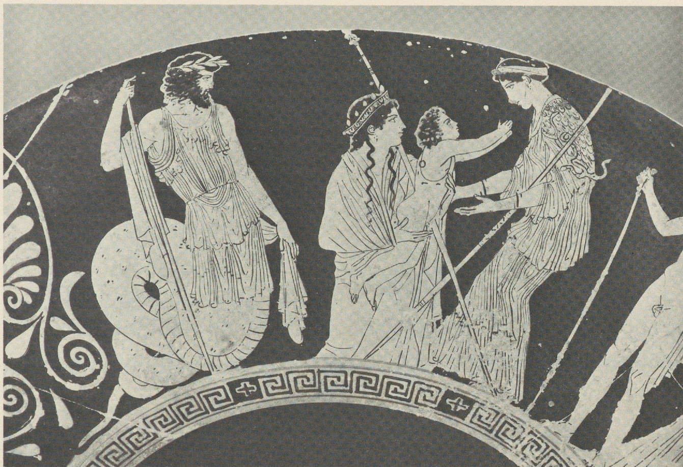
Fig. 2: Coupe du musée de Berlin.