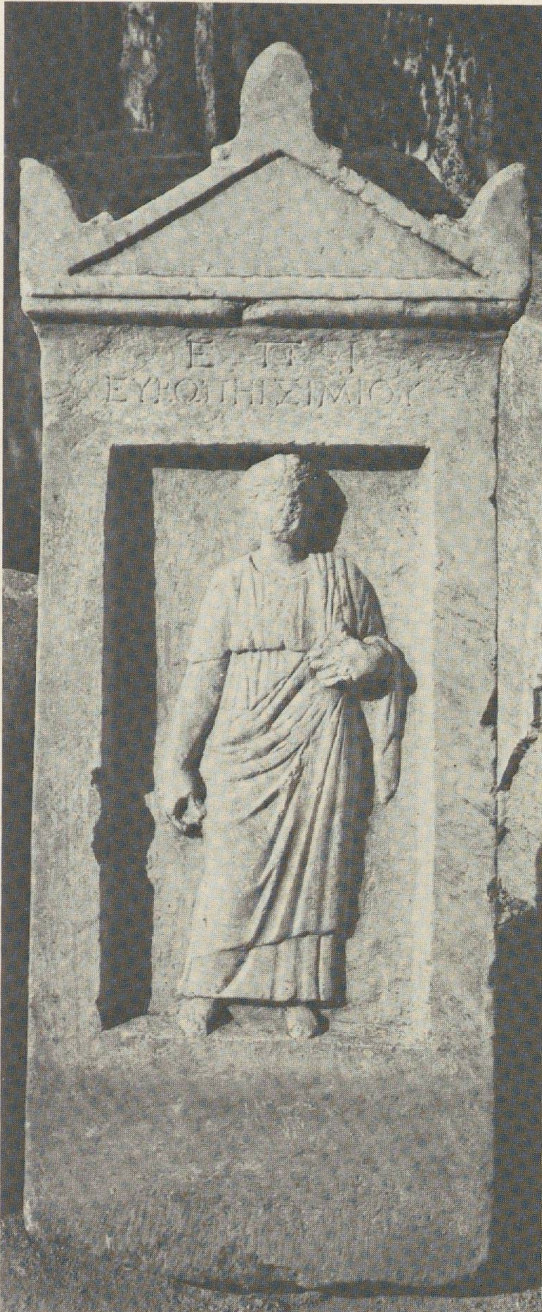
Fig. 3: Stèle d'Europè.