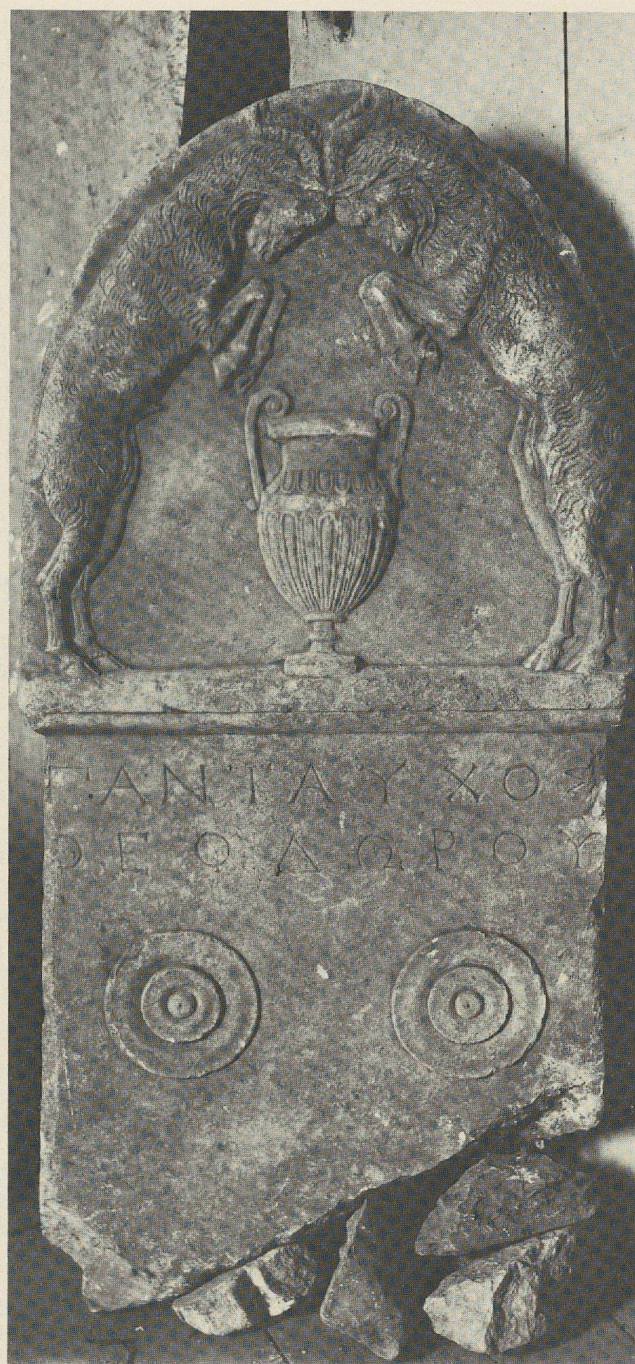
Fig. 2 : Stèle de Pantauchos.

L'inventaire, de même que le catalogue de Kastriotis 16 , nous apprend encore que cette stèle avait été donnée au Musée par Stéphane Dragoumis (1842-1923), plus connu sans doute par son activité politique, qui fut importante, que par ses travaux d'érudition, dont on n'a jamais dit trop de bien 17 . Dragoumis avait dû l'acquérir vers 1890, à l'époque où il siégeait au Conseil de la Société archéologique et où, surtout, il était député de la Mégaride 18 . On le voit en effet s'intéresser de près, durant ces années-là (1879-1895), aux antiquités de sa circonscription : en