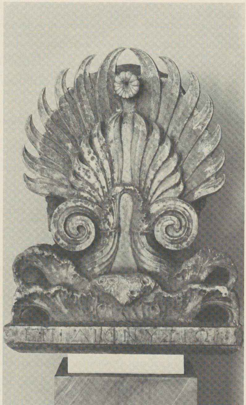
Fig. 4: Couronnement de stèle.

en attribuant le relief à l'époque romaine 48 : on a sans doute affaire — les spécialistes trancheront — à une œuvre du I er ou du II e siècle de notre ère. Le fronton, toutefois, par le type autant que par l'exécution, donne l'impression d'être plus ancien. De fait, il suffit de regarder un peu attentivement l'inscription pour s'apercevoir qu'elle est gravée sur un martelage; malheureusement on ne peut, je crois, déchiffrer avec certitude que la fin du patronyme de l'épithaphe primitive: - - - τειδου. Mais ce génitif «commun» est, à lui seul, un indice chronologique très intéressant, puisqu'il interdit de dater la stèle elle-même plus haut que le II e siècle avant J.-C. 49 , à moins de supposer, chose évidemment possible à Platées, qu'on ait réutilisé une stèle provenant de l'Attique.