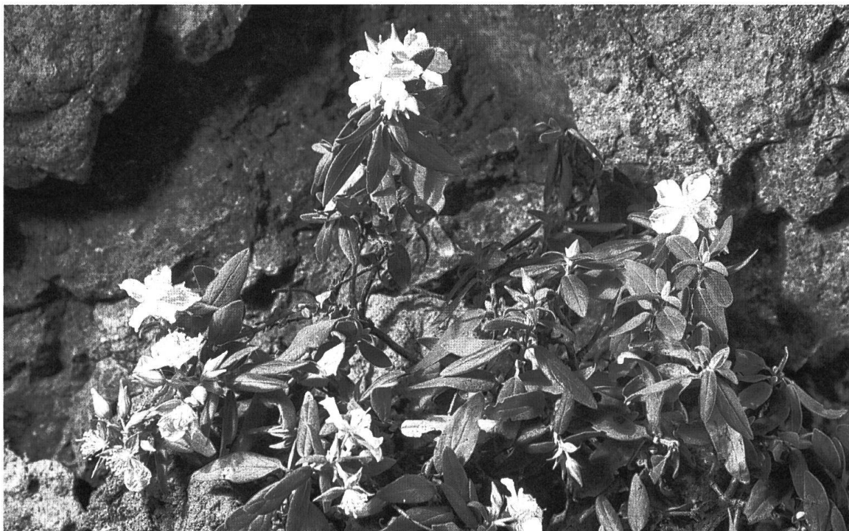
Fig. 6. – Helianthemum aganae Marrero Rodr. & R. Mesa. Aspecto general de la planta.

Petalis obovatis 8-9 × 6-6,5 mm. Staminibus (45-50), 3,3-3,7 mm. Stylo ab medium geniculato incurvato, 3,2-4 mm, stamina superante. Capsula ovoidea, subtrigona, sericea, usque ad 4,3-5 mm. Seminibus (15-20) subtiliter tuberculatis. – Floret Aprile-Maio, frutificat Iunium ad Iulium.