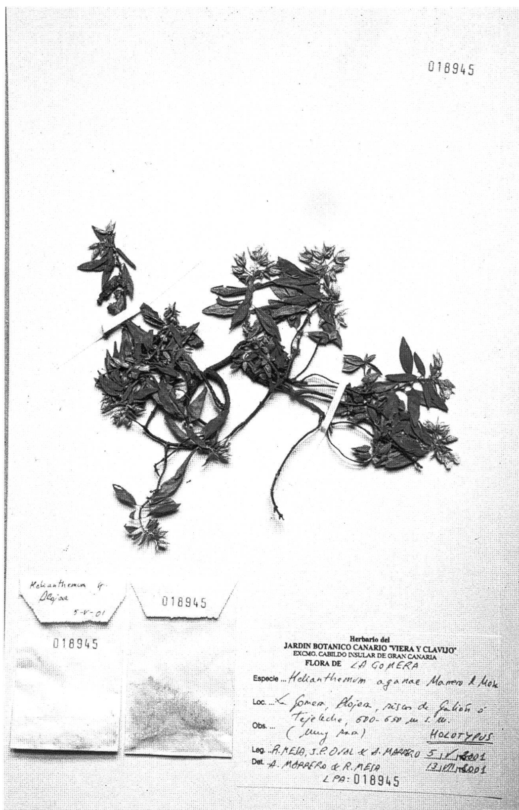
Fig. 4. – Helianthemum aganae Marrero Rodr. & R. Mesa. Holotypus.