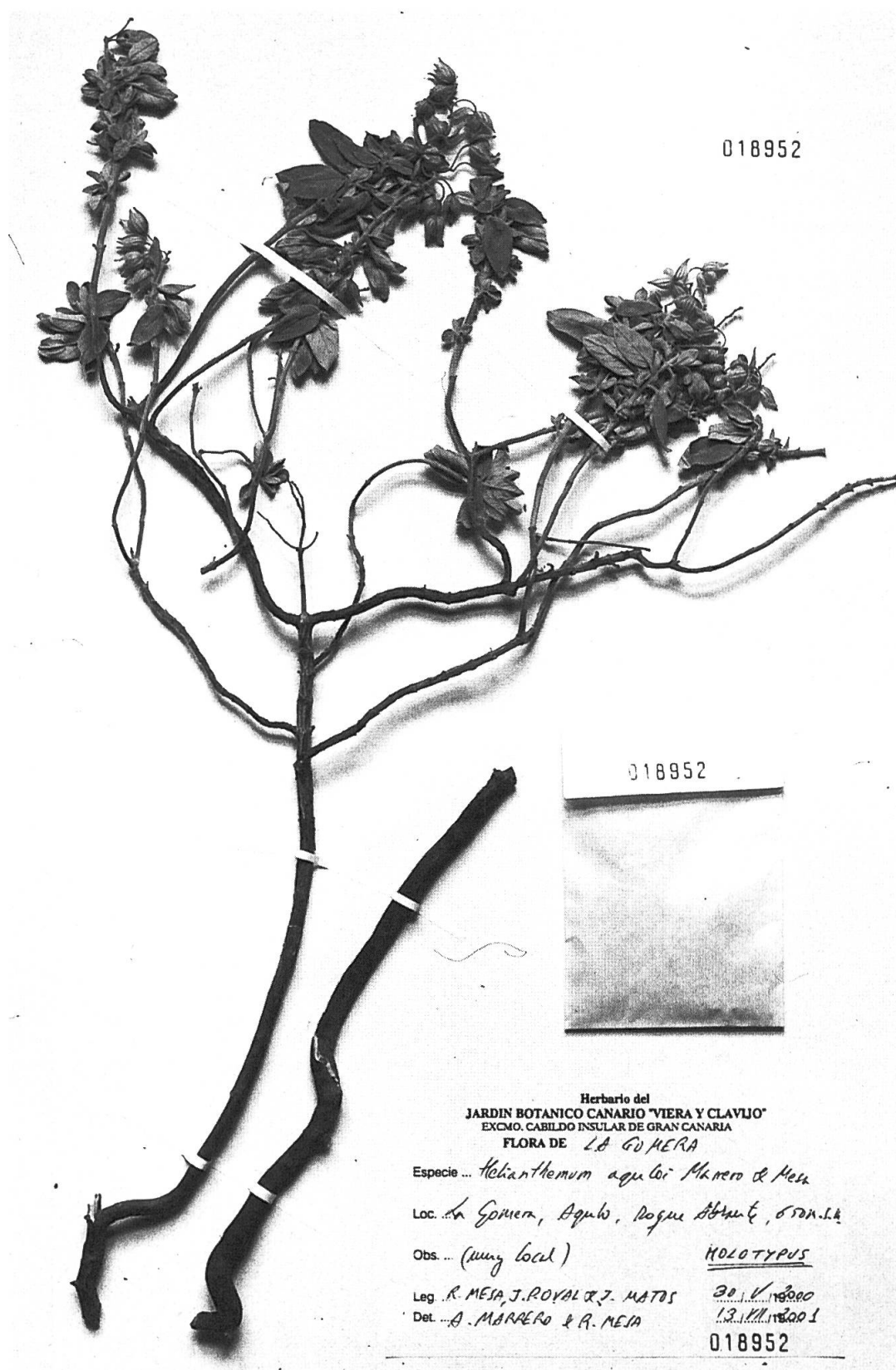
Fig. 1. – Helianthemum aguloi Marrero Rodr. & R. Mesa, LPA: 18952, Holotypus.