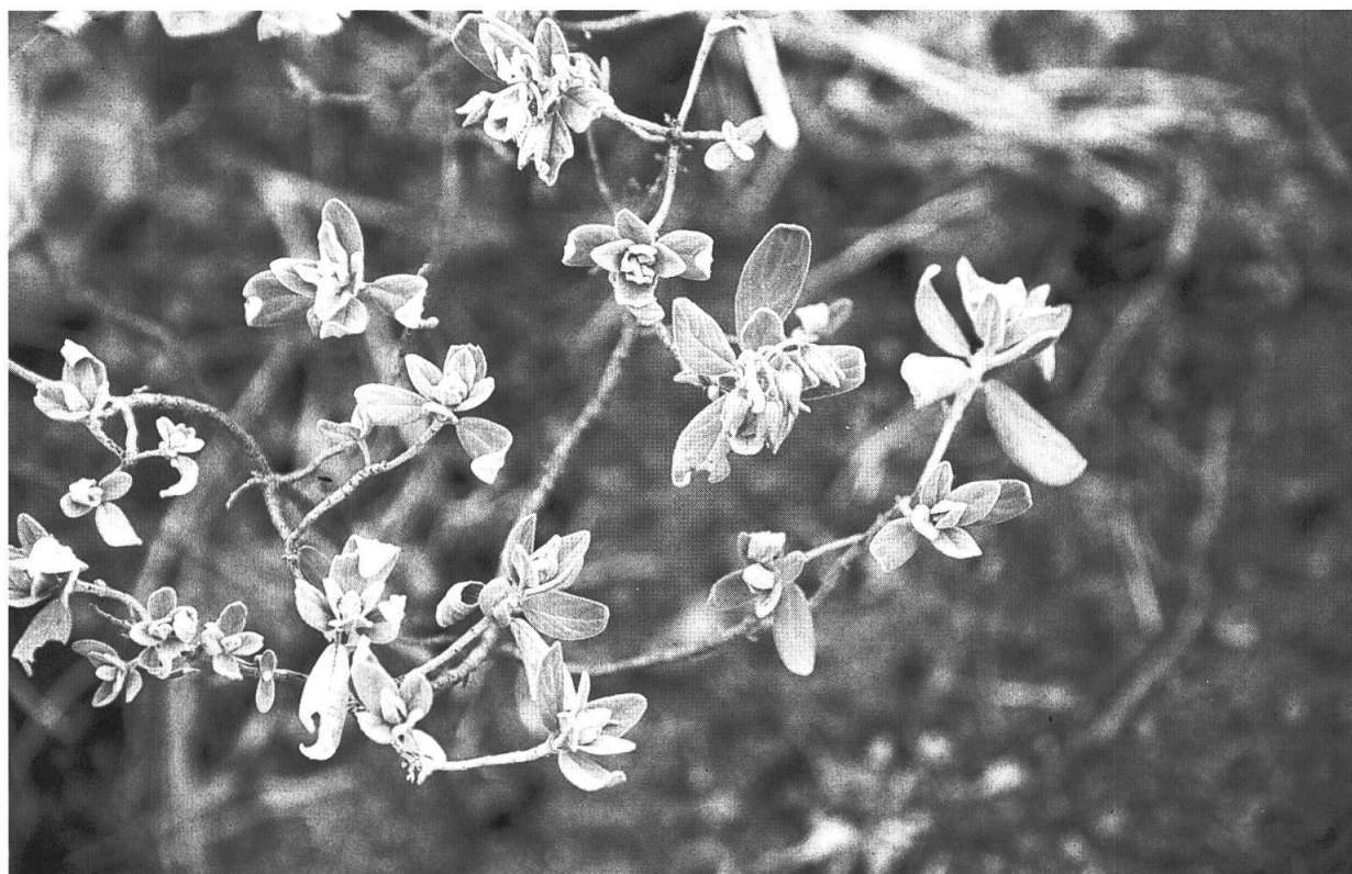
Fig. 3. – Helianthemum aguloi Marrero Rodr. & R. Mesa. Aspecto general de la planta.

cando en ocasiones Davallia canariensis (L.) Sm., y Euphorbia obtusifolia Poir. Otras especies del matorral son Spartocytisus filipes Webb & Berthel., Juniperus turbinata subsp. canariensis , (A. L. Guyot) Rivas Mart. & al., Euphorbia canariensis L., etc.