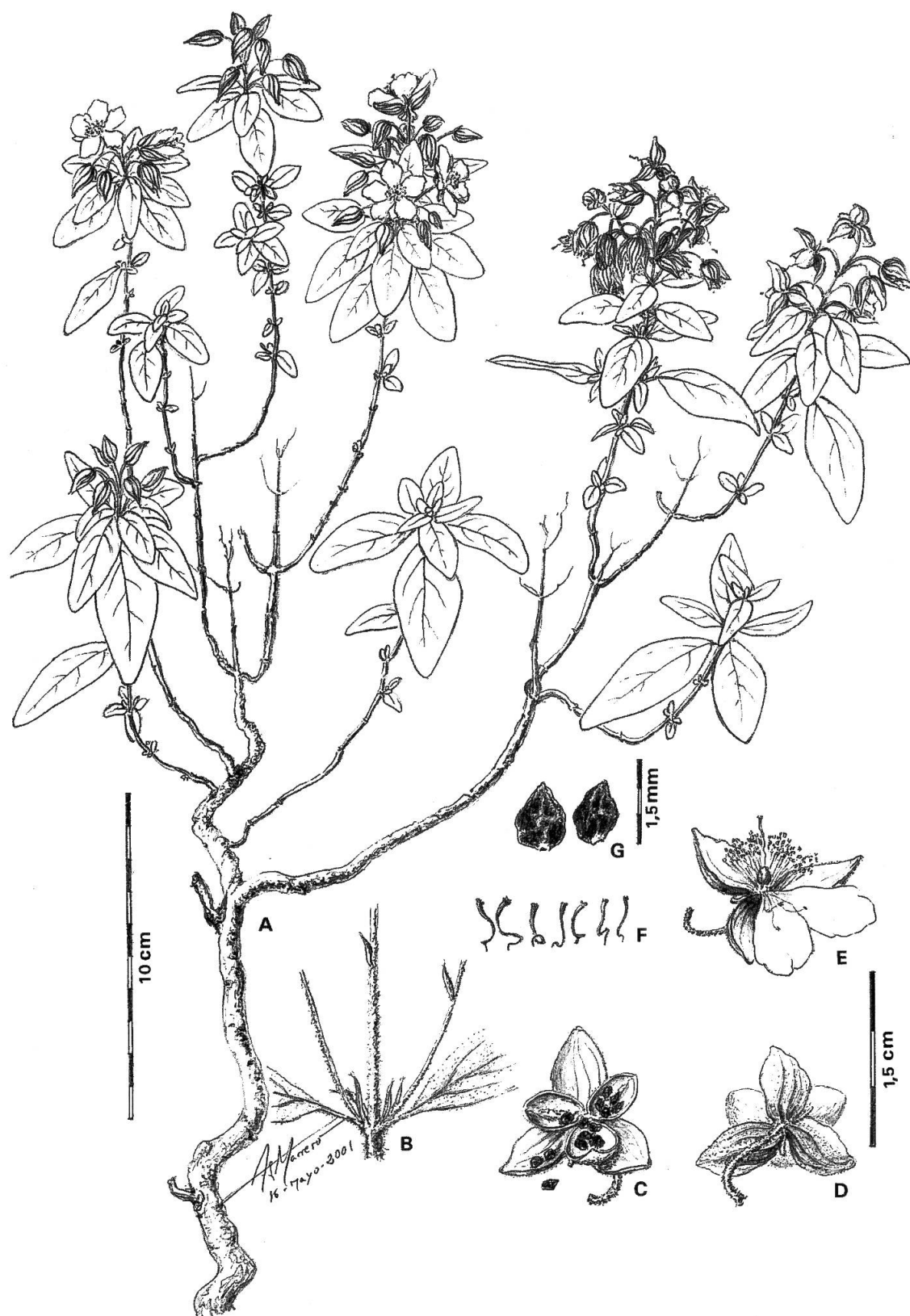
Fig. 2. – Helianthemum aguloi Marrero Rodr. & R. Mesa. A, porte general de la planta; B, detalle de estípulas y brácteas; C, detalle de cápsula y semillas; D, sépalos internos y externos; E, detalle de pétalos, estambres, ovario y pistilo; F, distintas apreciaciones del estilo geniculado hacia la base; G, semillas. [Dibujo A. Marrero]