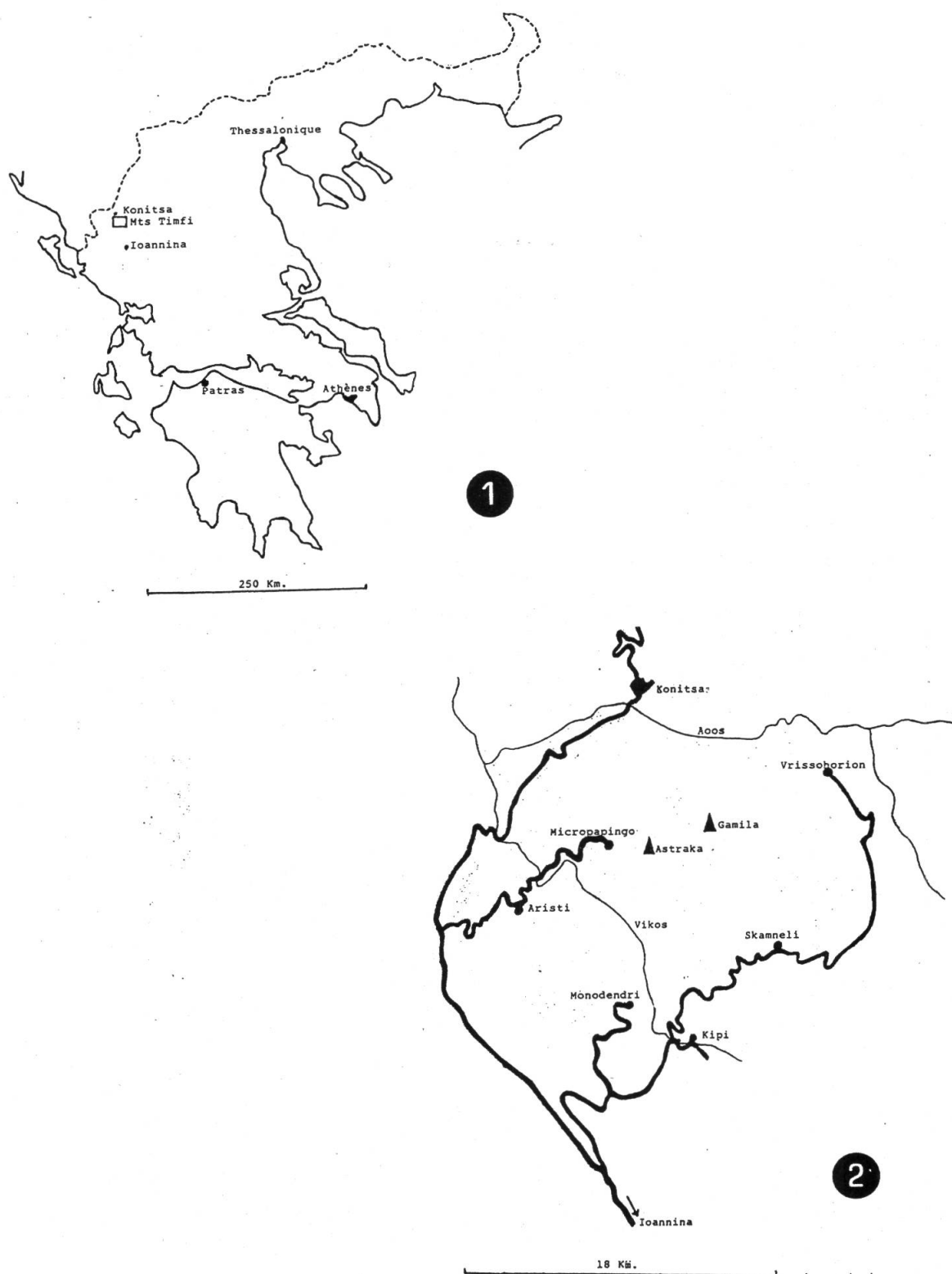
Fig. 1. – Carte 1 : situation des monts Timfi en Grèce. Carte 2 : carte locale (en gras: routes et pistes; en traits fins: cours d'eau (parfois temporaires)).