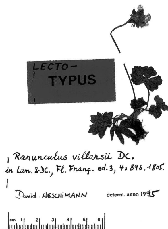
Photo 1. — Lectotype du Ranunculus villarsii DC.: échantillon en haut à gauche de la planche n° 344 de l'herbier de Villars, GRM.