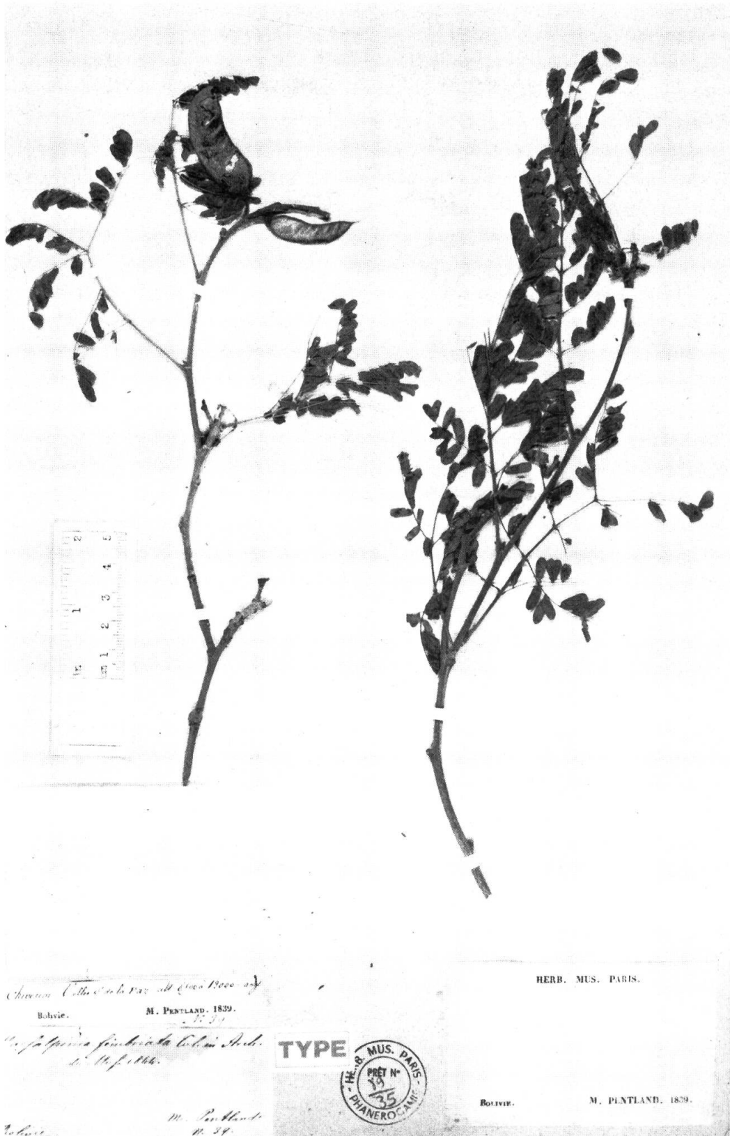
Fig. 1. — Caesalpinia fimbriata Tul.