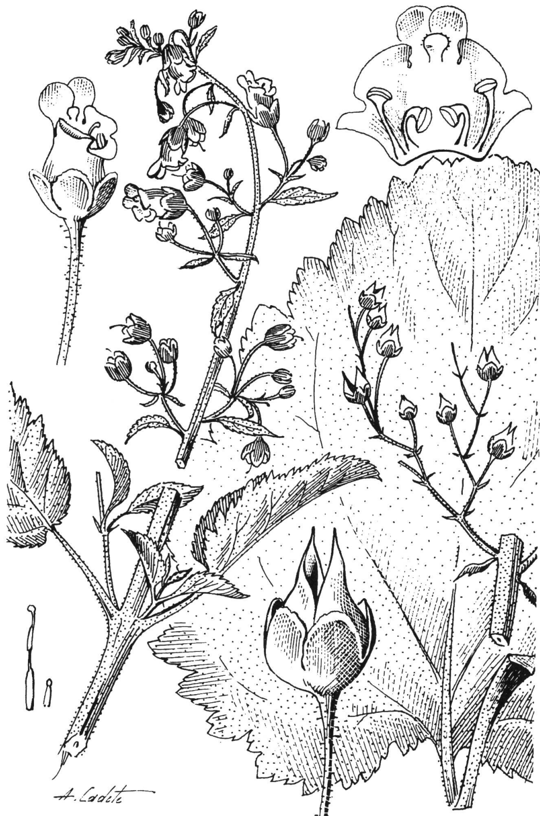
Fig. 2. — Scrophularia valdesii Ortega Olivencia & Devesa Alcaraz.