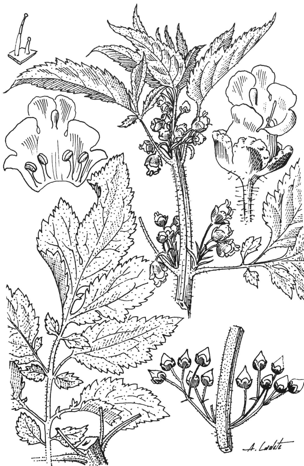
Fig. 1. — Scrophularia viciosoi Ortega Olivencia & Devesa Alcaraz.