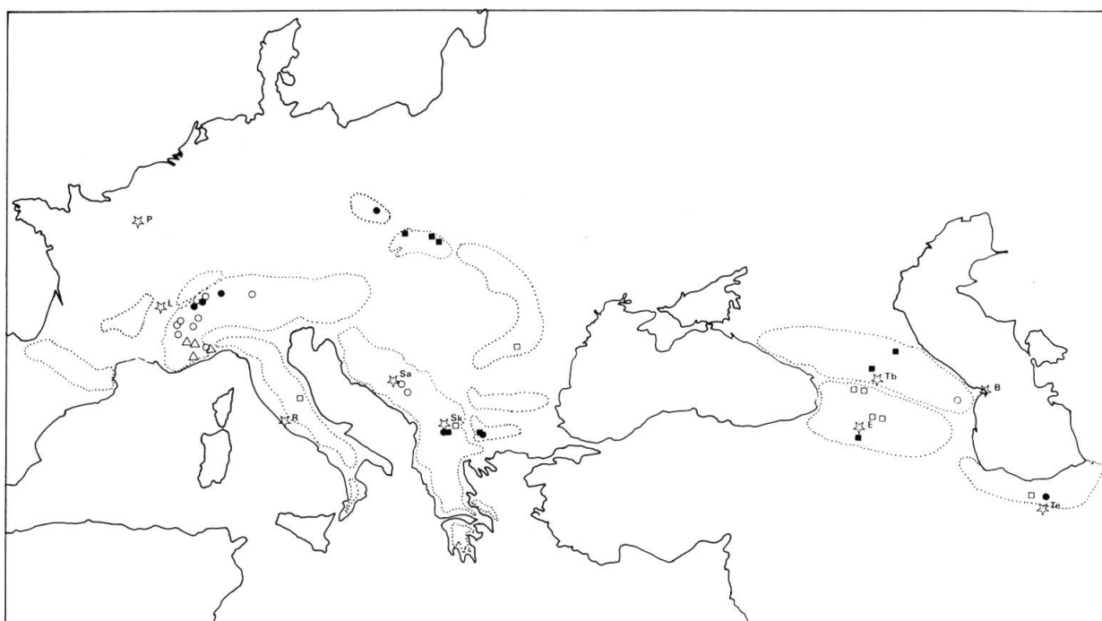
Fig. 1. — Répartition géographique des différentes races chromosomiques du P. atrata s.l. Un point peut représenter plusieurs populations.

Populations 2x comptées par l'auteur (○); par d'autres auteurs (●). Populations 4x comptées par l'auteur (□); par d'autres auteurs (■). Populations 6x comptées par l'auteur (△).