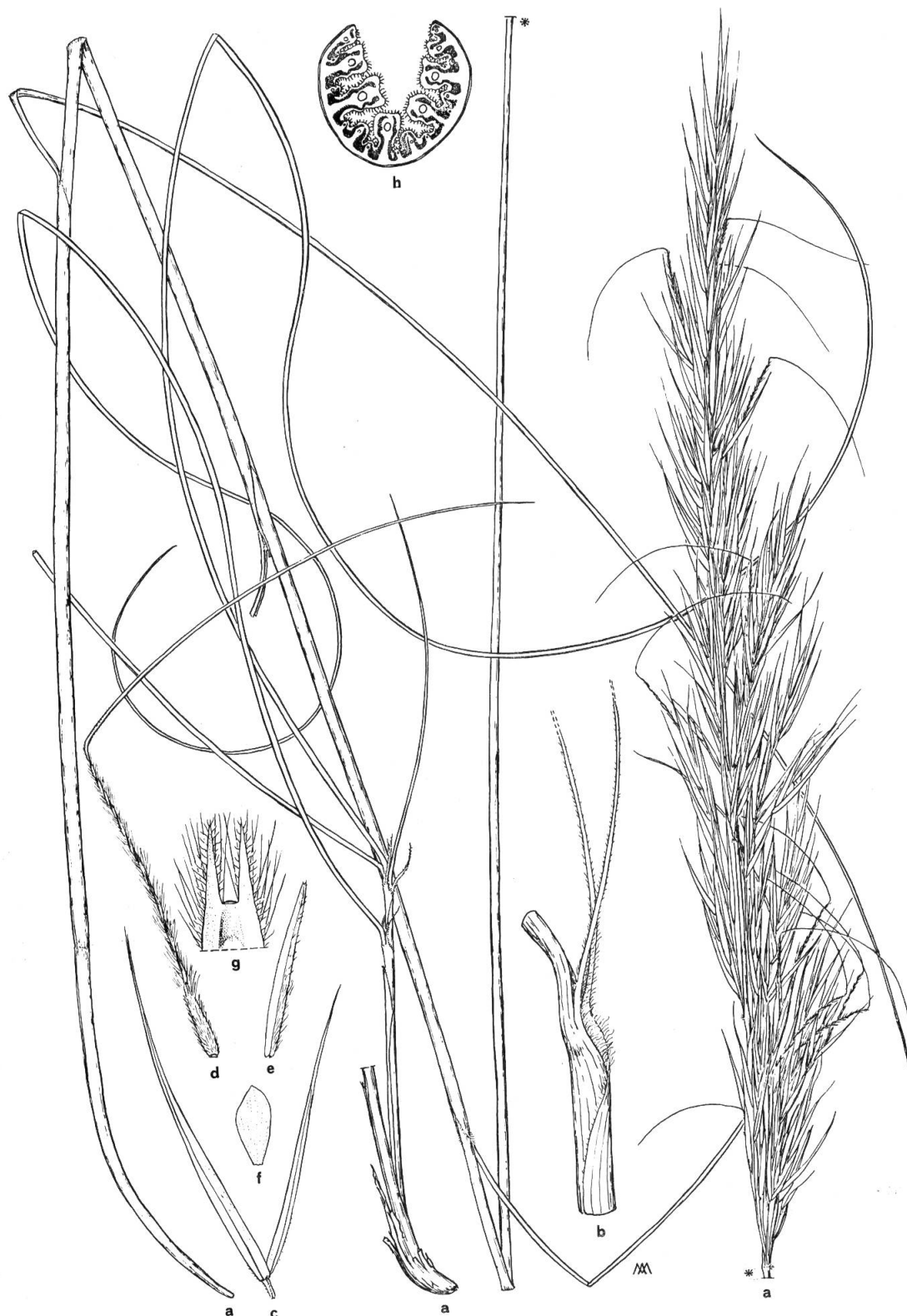
Fig. 2. — Stipa gabensis Moraldo, Raffaelli & Ricci a, plante complète ( \times 0.48 ); b, gaine foliaire avec oreillettes des ligules ( \times 2.35 ); c, glumes ( \times 1.40 ); d, lemme ( \times 1.40 ); e, paléole ( \times 2.9 ); f, lodicule ( \times 4.75 ); g, oreillettes du lemme ( \times 4.75 ); h, section de la feuille stérile ( \times 14 ).