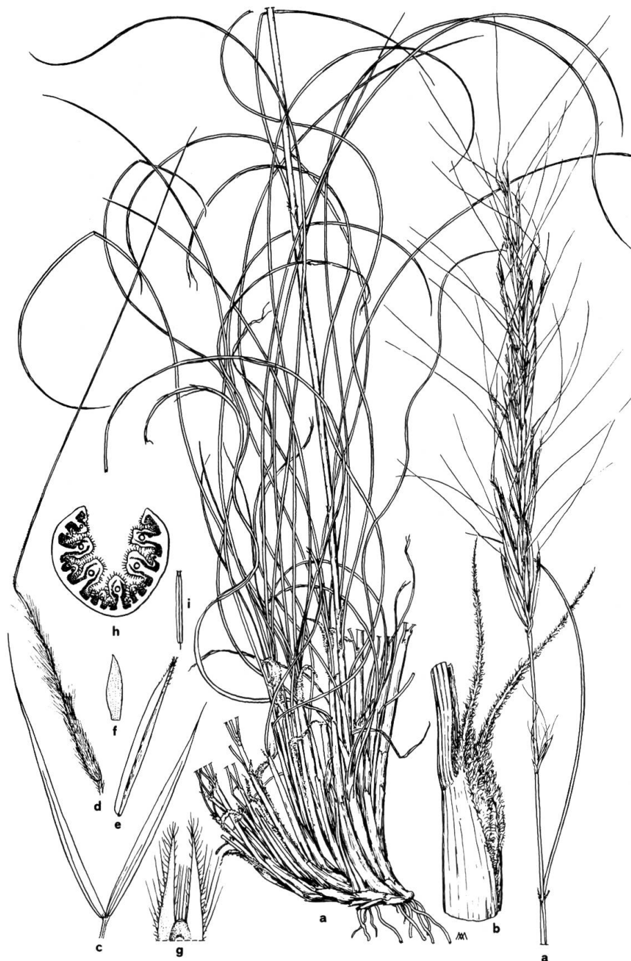
Fig. 3. — Stipa kelibiae Moraldo, Raffaelli & Ricceri a, plante complète ( \times 0.49 ); b, gaine foliaire avec oreillettes des ligules ( \times 4.7 ); c, glumes ( \times 1.5 ); d, lemme ( \times 1.5 ); e, paléole ( \times 3.0 ); f, lodicule ( \times 4.7 ); g, oreillettes du lemme ( \times 4.8 ); h, section de la feuille stérile ( \times 14.5 ); i, anthère ( \times 1.5 ).