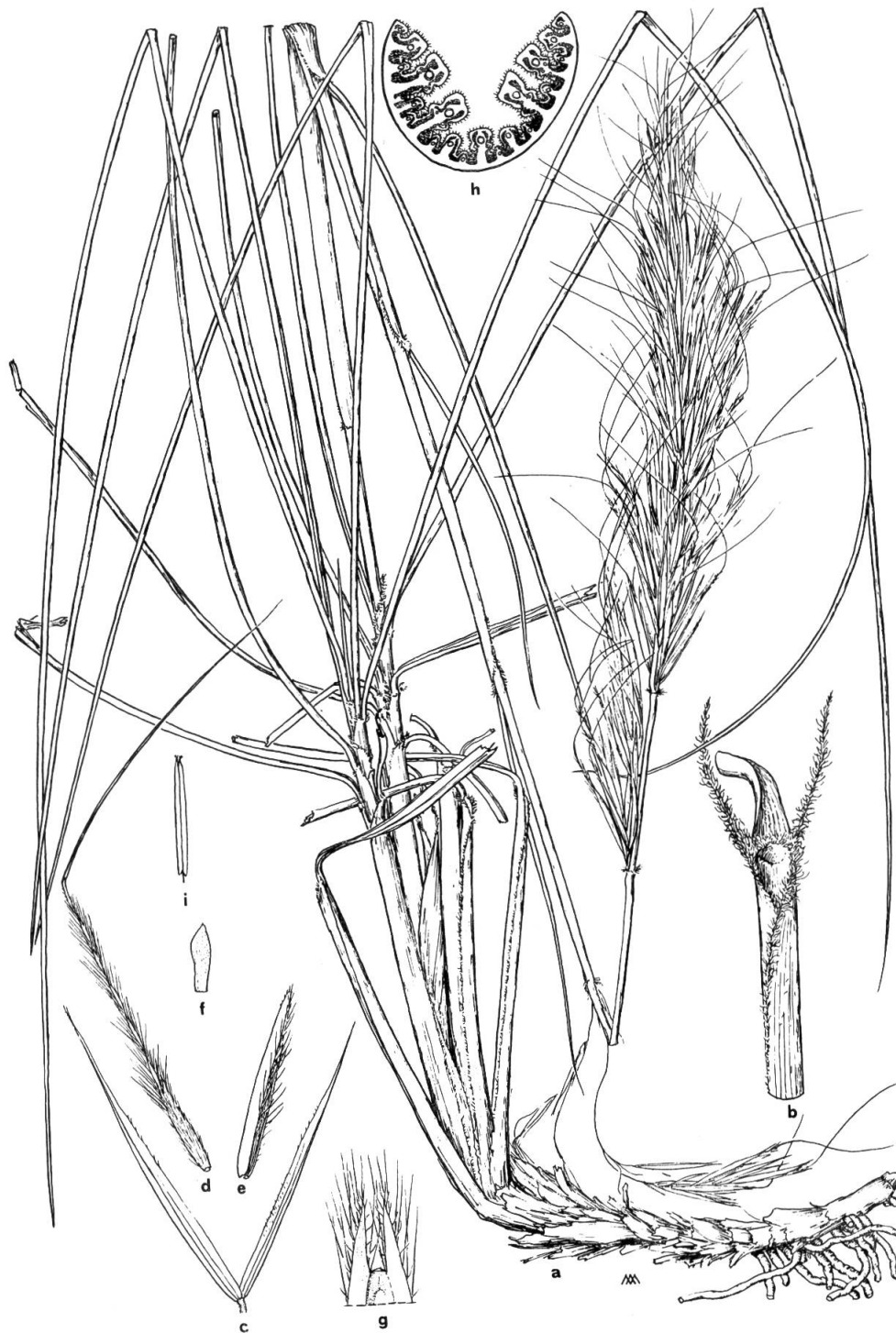
Fig. 4. — Stipa kralifii Moraldo, Raffaelli & Ricceri a, plante complète ( \times 0.49 ); b, gaine foliaire avec oreillettes des ligules ( \times 1.5 ); c, glumes ( \times 1.5 ); d, lemme ( \times 1.5 ); e, paléole ( \times 2.9 ); f, lodicule ( \times 4.7 ); g, oreillettes du lemme ( \times 4.7 ); h, section de la feuille stérile ( \times 9.5 ); i, ( \times 1.5 ).