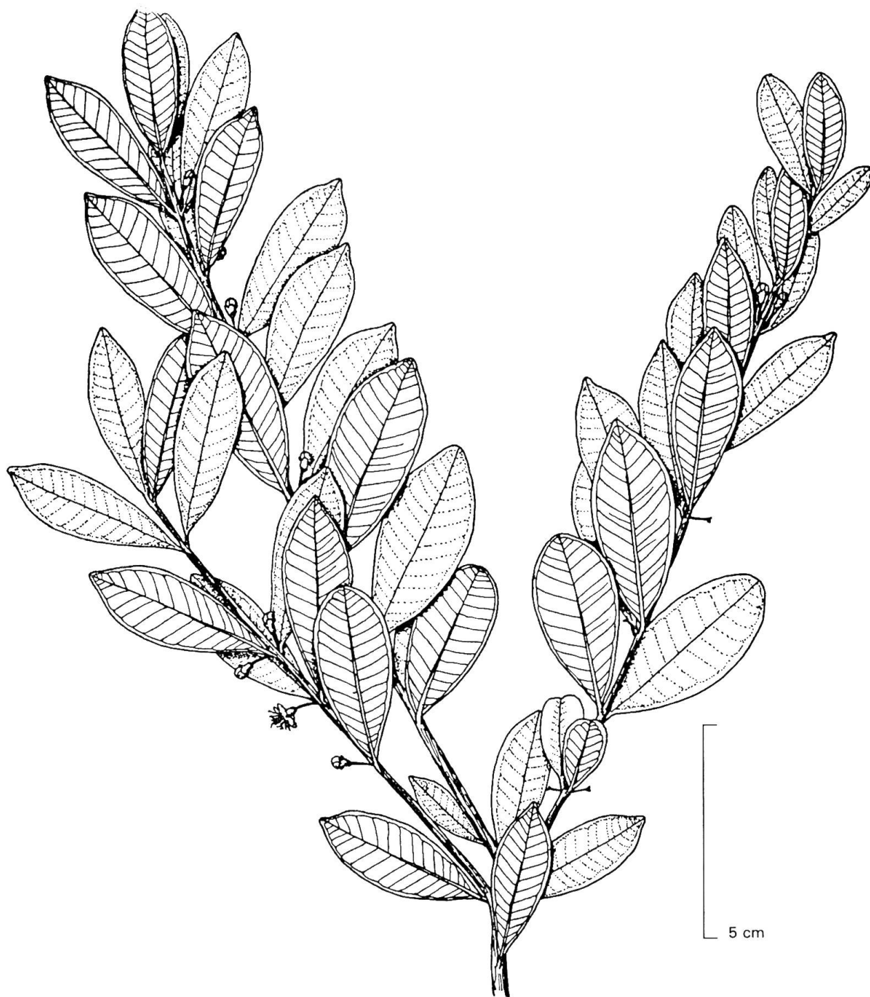
Fig. 1. — Eugenia puniceifolia (Kunth) DC. Aspecto general de la planta (Hassler 6757).