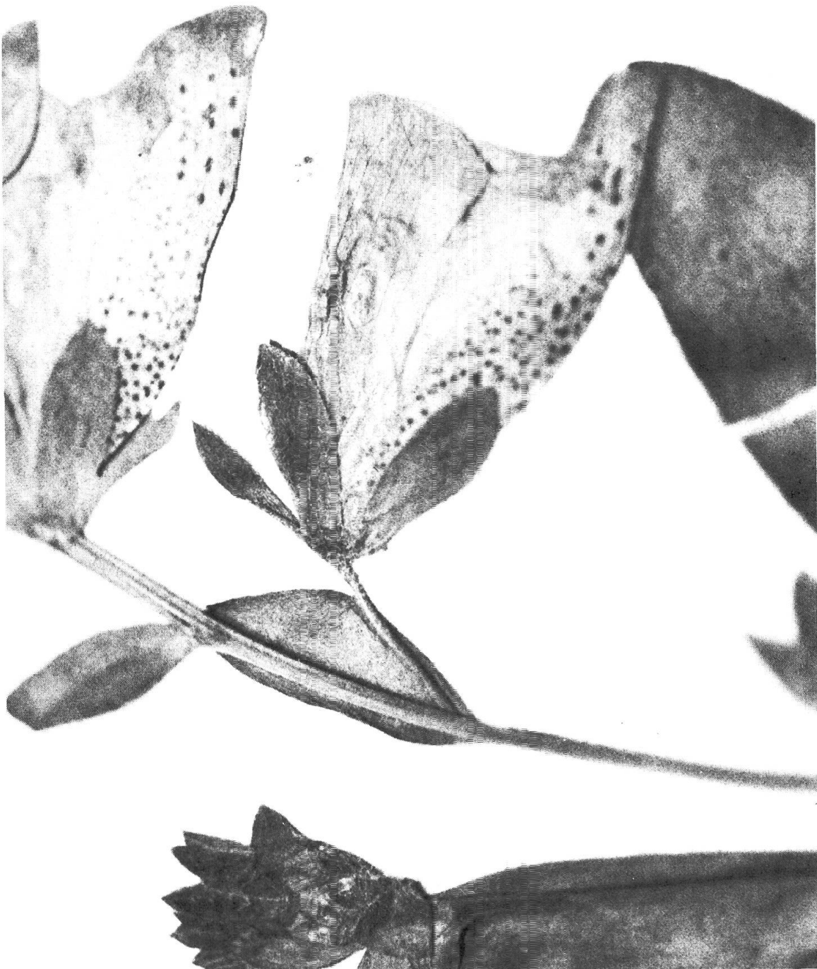
Fig. 1. — Lectotype du D. minor L. (LINN 775.2) Détails des fleurs: r-m-a-q-r la forme des sépales et les pétales latéraux découpés.