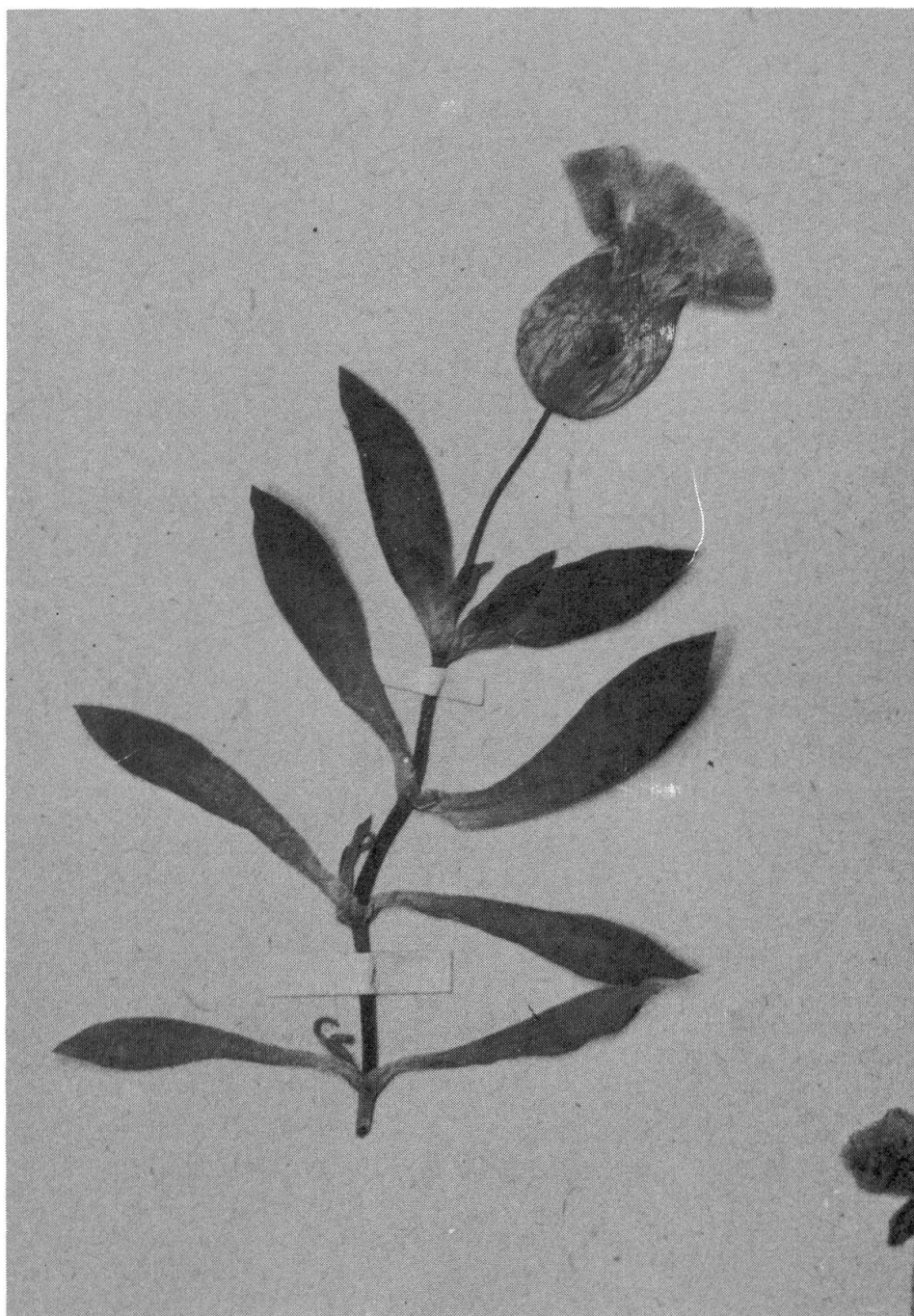
Photo 4. – Lectotype du Cucubalus alpinus Lam. Seul l'échantillon en haut à droite de la feuille est ici reproduit. P.