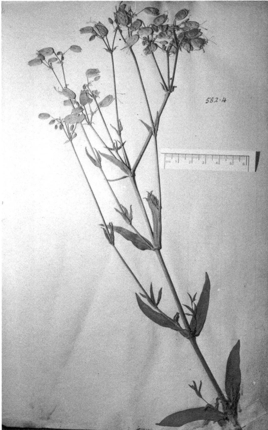
Photo 1. – Lectotype du Cucubalus behen L. On distingue l'indication "2 foemina" en bas de feuille. LINN.