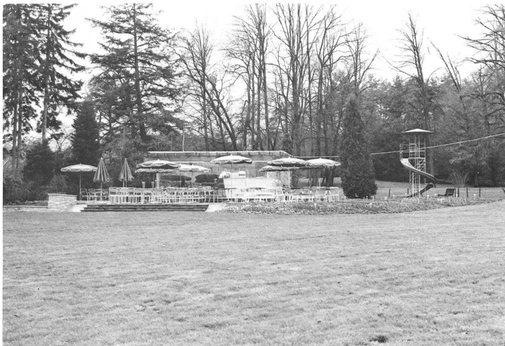
3. Une véranda appréciée des promeneurs et un toboggan qui enchante les petits.