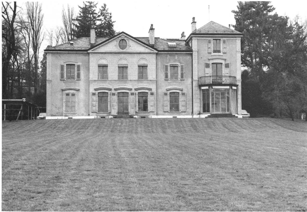
1. La Villa “Le Chêne” qui doit être restaurée en 1970.