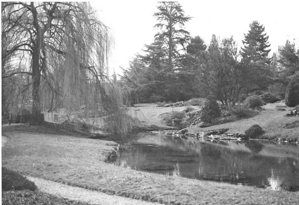
4. Un des multiples aspects du jardin.