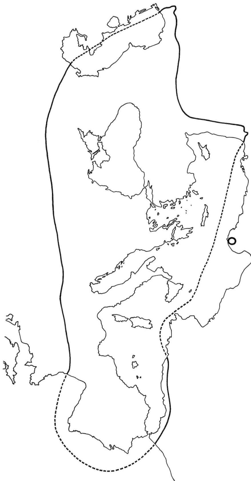
FIG. 2. — L'aire de distribution du genre Crocus (d'après Maw 1886). Le cercle noir indique la provenance du C. Boulousii .