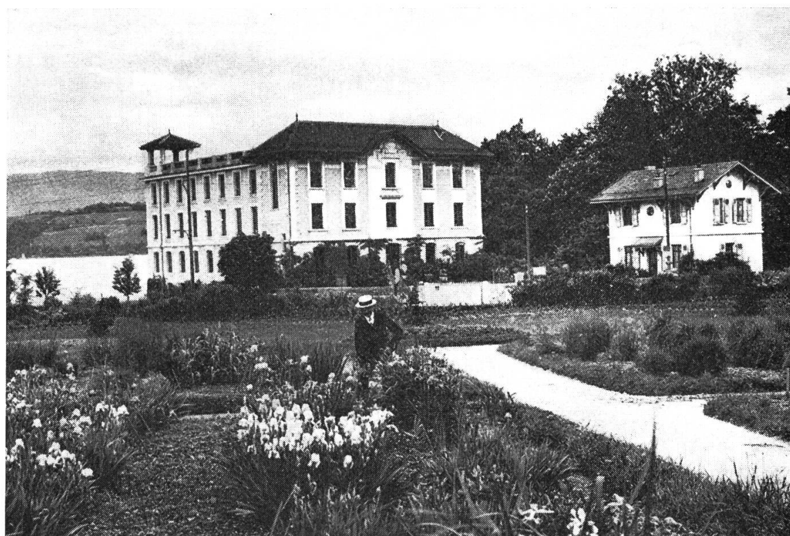
Fig. 2. — La Console vue du chemin de fer en 1905