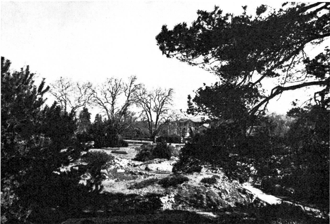
Fig. 6. — Le jardin alpin actuel