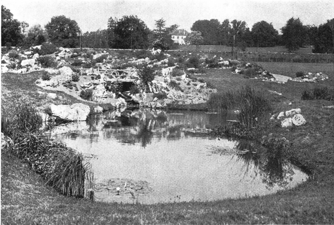
Fig. 3. — L'étang en 1905