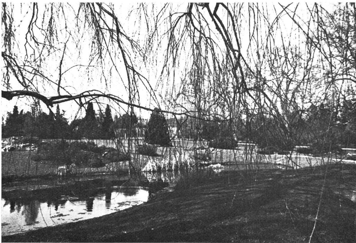
Fig. 4. — L'étang en 1968