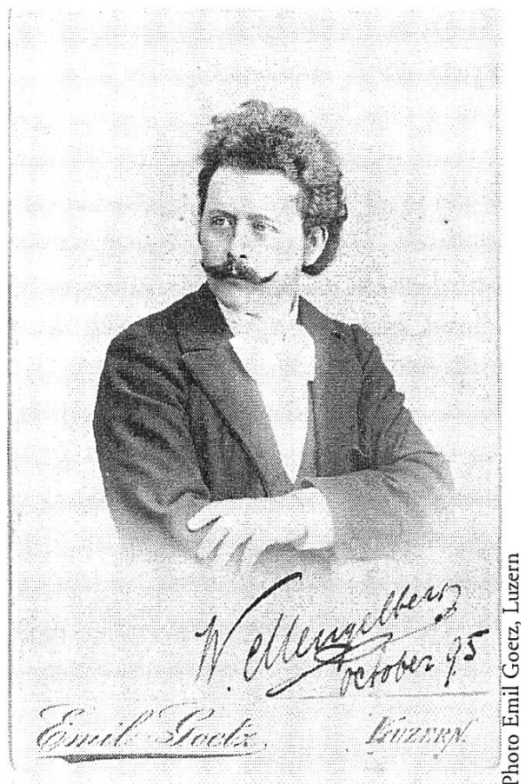
Willem Mengelberg in Luzern, Oktober 1895

1945 als Strafe verboten, je wieder in den Niederlanden zu dirigieren. Er fiel in Ungnade und zog sich, unverstanden und einsam, ins Exil in die Schweiz zurück. Das Appellationsverfahren endete 1947 mit einer Reduzierung der lebenslänglichen Verbannung auf sechs Jahre, bis 1951. Bis zu seinem Tode im Jahre 1951 blieb Mengelberg in seinem Chalet in Zuort.