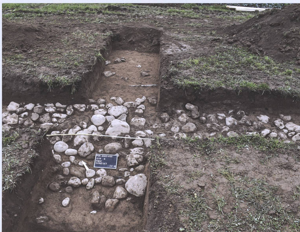
Fig. / Abb. 2

J. Monnier – L. Rubeli – H. Vigneau, «5000 ans d'histoire sur 2,5 km à Prez-vers-Noréaz», CAF 22, 2020, 18-19.