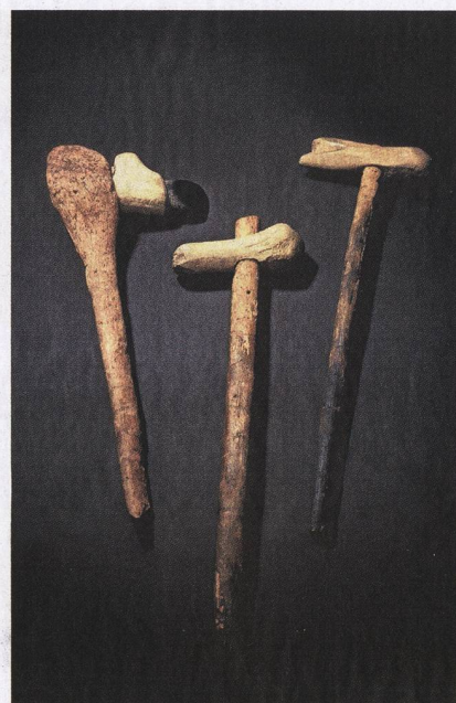
In der Jungsteinzeit fertigten die Menschen spezielle Werkzeuge.

zen, mehr als die Menschen zum gelegentlichen Jagen von Wildtieren gebraucht hätten. Ein Hinweis auf eine bewes-