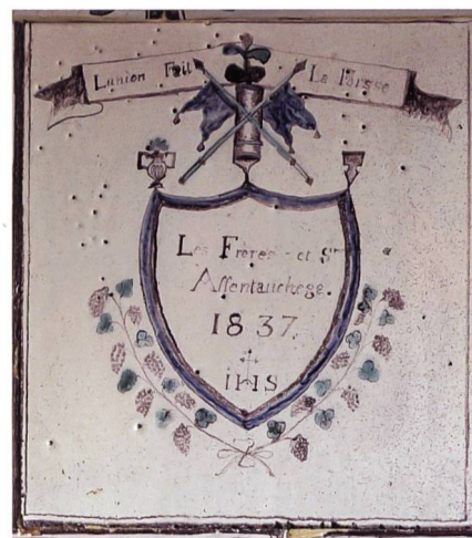
Fig. 3 La signature de l'atelier et la date de 1837

Avec les déchets de l'atelier, les poêles encore conservés à Bulle et dans le canton (42 recensés) 5 , auxquels vient s'ajouter ce lot de catelles, nous avons à disposition aujourd'hui, une base de données