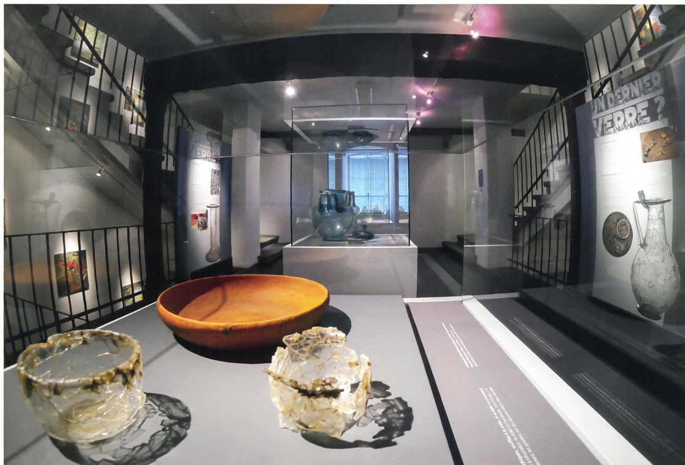
Fig. 1 Vue d'un étage de l'exposition qui se tient du 21 juin 2014 au 20 septembre 2015 au Service archéologique

Mise sur pied en marge du 20 e congrès de l'Association Internationale pour l'Histoire du Verre 1 , l'exposition «Un dernier verre? Archéologie d'une matière» présente le verre des collections archéologiques fribourgeoises, parfois conservé, pour les anciennes découvertes, au Musée d'art et d'histoire de Fribourg ainsi qu'au Musée d'Histoire de Berne.