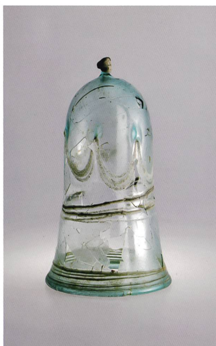
Fig. 2 Gobelet campaniforme mérovingien