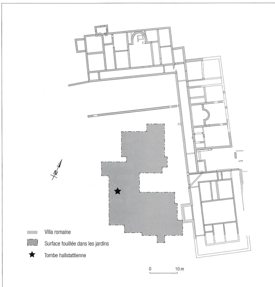
Fig. 2 Vallon/Sur Dompière, emplacement de la tombe hallstattienne

Les agrafes de ceinture ovales sont relativement fréquentes dans les tombes féminines du Ha C de Suisse occidentale, de la région Berne-Soleure et du Valais. Une variante dite «de Subingen», ornée d'un décor au trémolo (sorte de zigzag), est présente dans des ensembles attribués au Ha D1 (environ 650-550 avant J.-C.). L'exemplaire de Vallon, de par son décor, en est très proche: la partition de l'espace est identique et l'effet visuel général, formé par les alignements de traits parallèles, rappelle celui du trémolo. Sa taille et le nombre de languettes