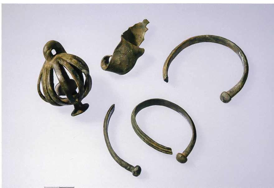
Fig. 1 Lot d'objets en bronze découvert à Vallon en 2012

Des fouilles-écoles sont réalisées depuis 2006 à l'emplacement des jardins de la villa afin de documenter les aménagements horticoles ainsi que les structures d'habitat liées à l'occupation tardive. A la fin de la campagne 2012, un contrôle à la pelle mécanique des niveaux antérieurs à l'occupation romaine a mis en évidence, dans un sédiment pauvre en éléments lithiques, une petite concentration constituée d'une quarantaine de cailloux