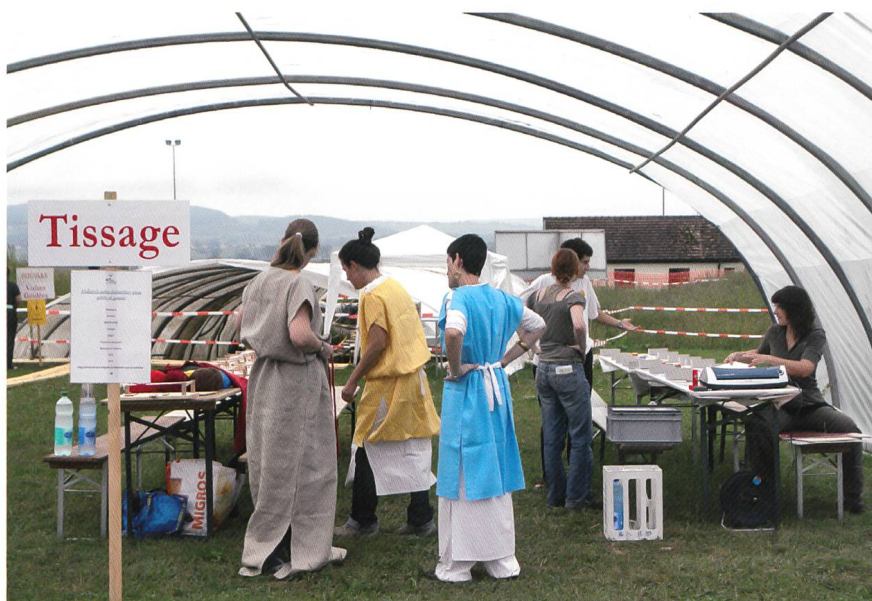
Fig. 3 Vinalia, derniers préparatifs avant l'arrivée des visiteurs

L'exposition «Vallon: côté JARDIN, côté cour», créée par le Musée en 2006, a été adaptée et présentée à l'Espace archéologique municipal Aristide Fabre de Cavalaire-sur-Mer (F), du 29 mars au 25 septembre 2011.