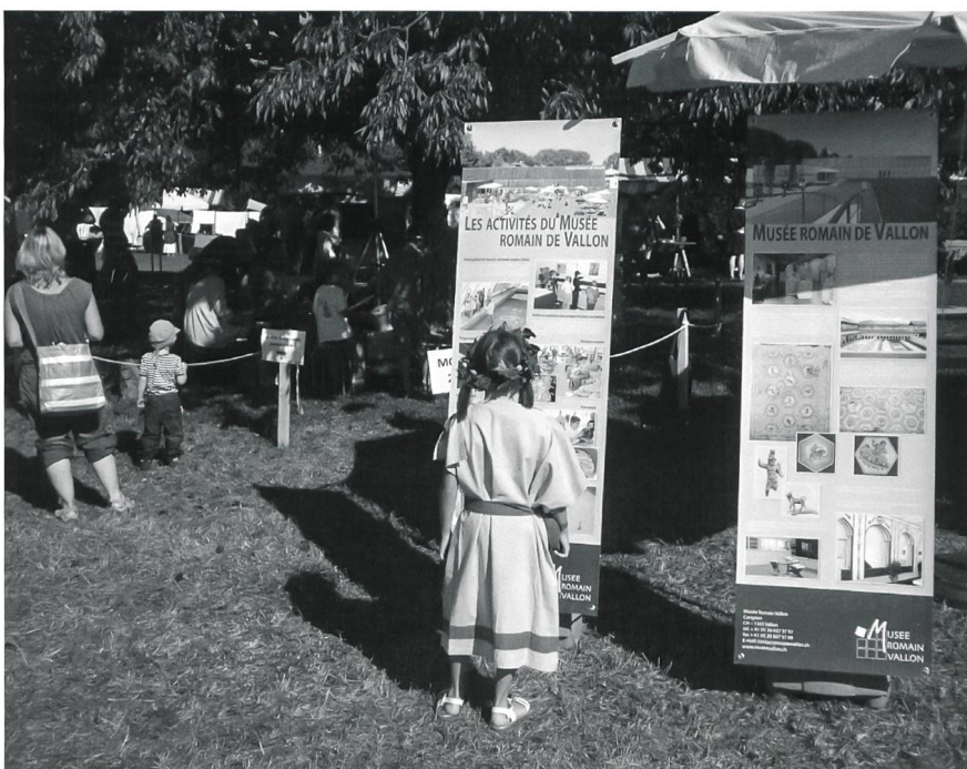
Fig. 2 Le Musée Romain de Vallon se présente lors de la «Römerfest» à Augst