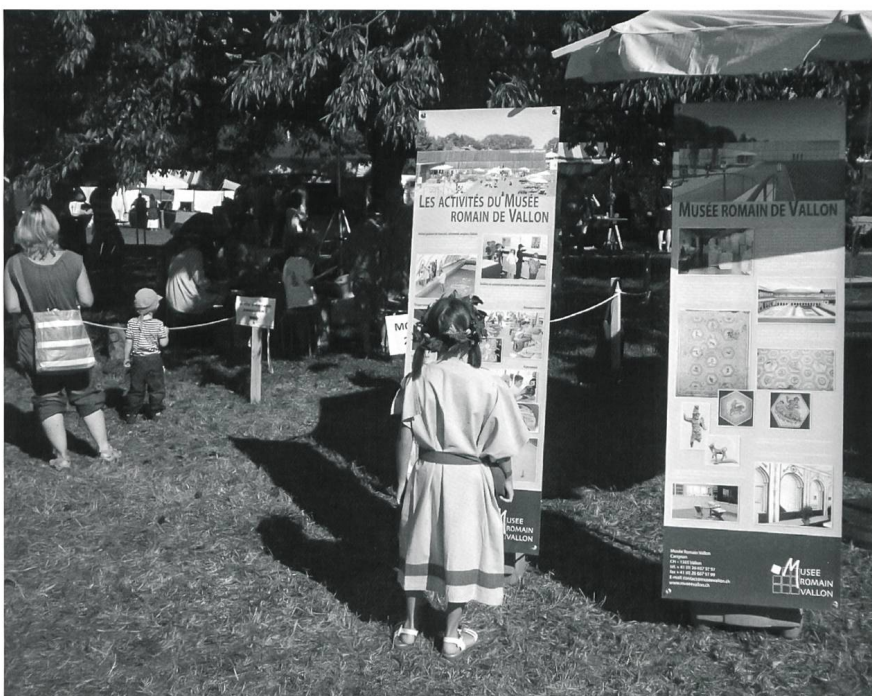
Fig. 2 Le Musée Romain de Vallon se présente lors de la «Römerfest» à Augst