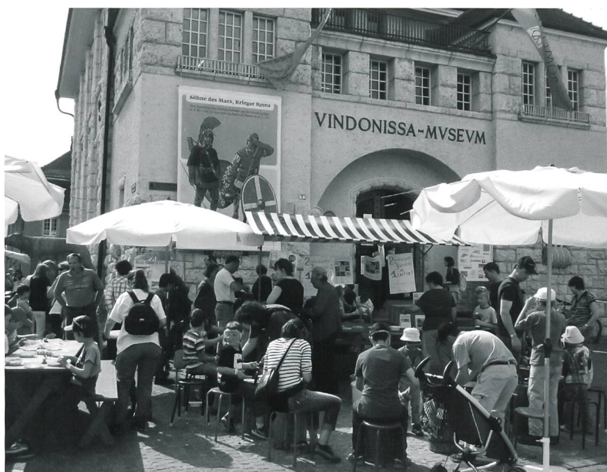
Fig. 1 Le Musée romain de Vallon et son atelier mosaïque au «Römertag» à Vindonissa

La participation active du Musée à de nombreux événements culturels pendant l'année 2011 a été marquée notamment par: