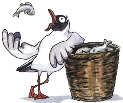
Fig. 3 Nautica, la mouette gourmande

Des traductions en anglais voire en italien pourraient également être envisagées.