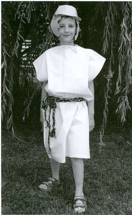
Fig. 2 L'habit ne fait pas le légionnaire

gratuites et des contes mythologiques les dimanches après-midi.