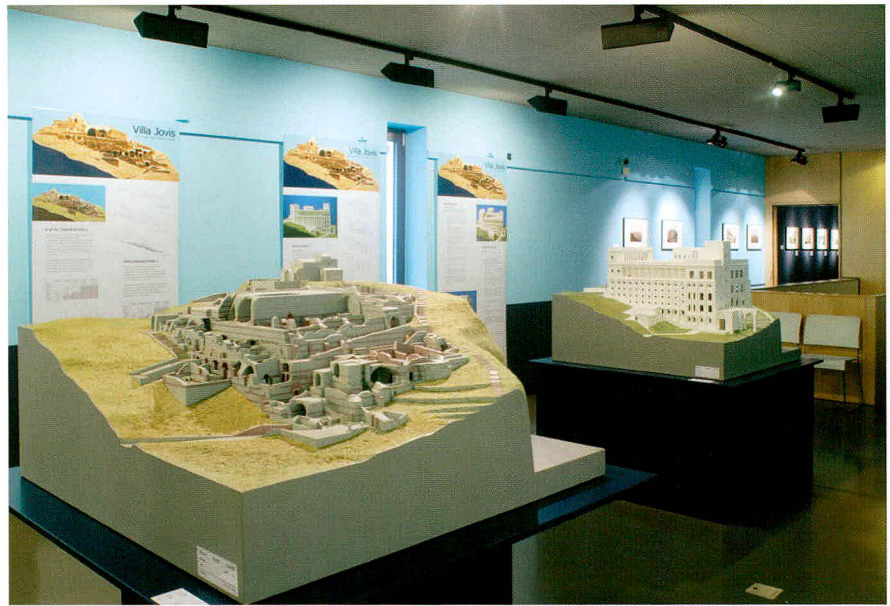
Fig. 1 L'exposition «Villa Jovis. La résidence de Tibère à Capri» et ses deux maquettes

Réalisée il y a sept ans à la Skulpturhalle de Bâle BS, avec le titre «Villa Jovis. Die