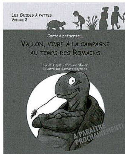
Fig. 5 Cortex, la tortue qui va guider les enfants à Vallon

Les deux projets didactiques lancés en 2008 se sont poursuivis avec succès. La rédaction du fascicule consacré à notre établissement et présentant la vie à la campagne à l'époque romaine est presque terminée. Cortex , le deuxième volume de la série Les Guides à pattes destinée aux enfants en âge scolaire, sortira à l'automne 2010 et pourra être