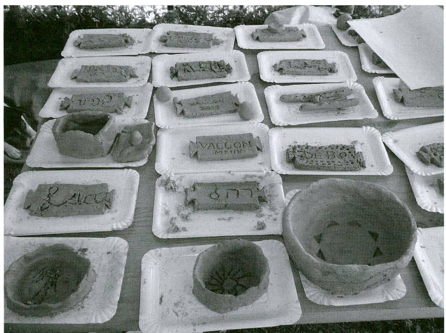
Fig. 3 L'atelier «argile» du Römermuseum d'Augst

La «Nuit du conte», qui avait pour titre cette année «Quand le monde était jeune», s'est déroulée le vendredi 13 novembre, avec la collaboration d'une conteuse de l'association Contemuse. Elle a attiré plus d'une vingtaine de personnes, des enfants pour la plupart, venus seuls ou en famille.