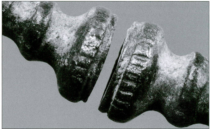
Fig. / Abb. 4 Détail des tampons de l'un des anneaux Detailaufnahme vom Stempelende eines der Ringe

La paire d'anneaux de Farvagny ornait donc vraisemblablement les chevilles d'une femme inhumée à La Tène ancienne. Sous réserve de nouvelles découvertes, ce sont les comparaisons typologiques qui nous incitent à les attribuer plus précisément à LT B2.