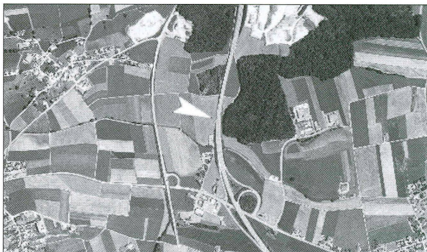
Fig. / Abb. 1

A l'instar de tous les objets archéologiques privés de leur contexte de découverte, ces deux objets sont devenus de facto des pièces en suspension dans le champ de la pensée archéologique. Reconstruire leur cheminement passe, en effet, par l'utilisation de beaucoup de filtres que l'archéologue doit reconnaître et maîtriser. En fait, chacune des questions qu'il se pose les concernant doit pointer vers une même fin: tenter de reconstituer à partir d'eux-mêmes une partie du passé dont ils émanent et qui s'est évanoui. Il est clair que cette histoire, élaborée à partir de maigres éléments, demeurera toujours par bien des aspects fragile, cela d'autant que des événements qui paraissent dépourvus de tous liens entre eux et des circonstances dont la concomitance semble un simple hasard viennent bien souvent «s'imbriquer» et ainsi, brouiller les pistes. En ce sens, il est donc évident que toute tentative de recomposition de leur histoire ne pourra en aucun cas totalement dépasser le domaine des connaissances imparfaites et mal fondées.