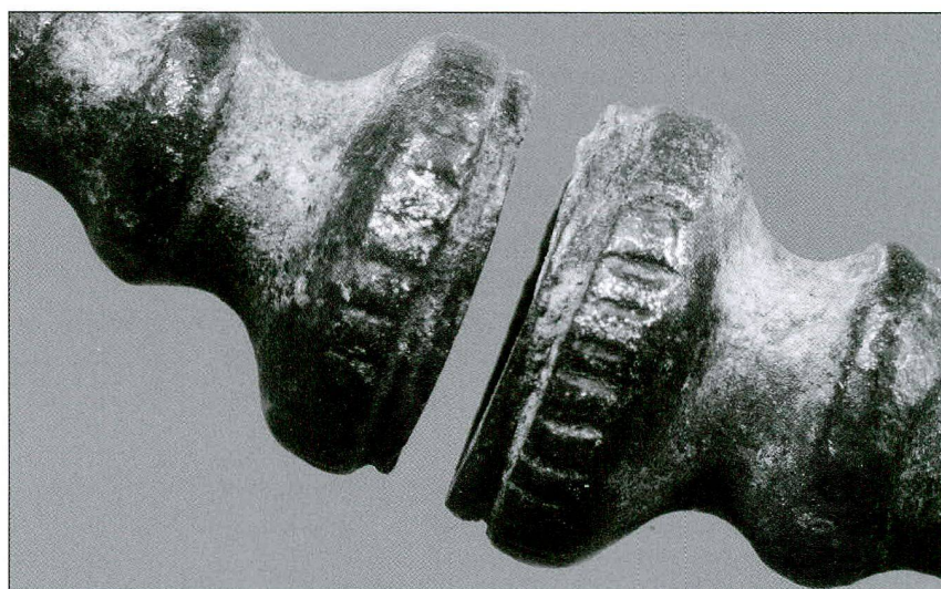
Fig. / Abb. 4 Détail des tampons de l'un des anneaux Detailaufnahme vom Stempelende eines der Ringe

La paire d'anneaux de Farvagny ornaît donc vraisemblablement les chevilles d'une femme inhumée à La Tène ancienne. Sous réserve de nouvelles découvertes, ce sont les comparaisons typologiques qui nous incitent à les attribuer plus précisément à LT B2.