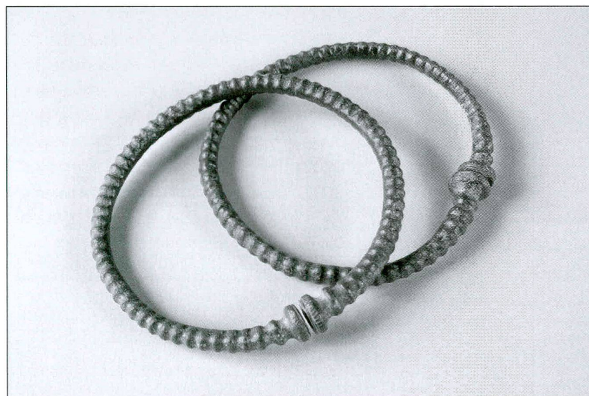
Fig. / Abb. 3 Les deux anneaux Die beiden Ringe

En comparant les dimensions de quelques anneaux de différents types provenant de Saint-Sulpice/En Pétouleyres VD 8 , nous avons remarqué que le diamètre interne moyen des bracelets était de 57 mm, celui des anneaux de cheville de 75 mm. Une appréciation rapide d'autres découvertes de La Tène ancienne confirme en général cet ordre de grandeur. D'après leur diamètre interne, les deux exemplaires de Farvagny entreraient donc plutôt dans la catégorie des anneaux de cheville.