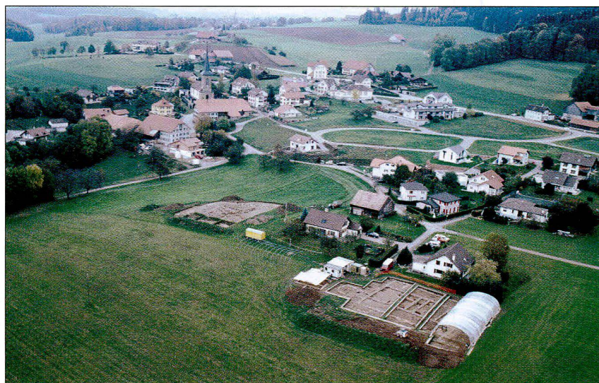
Fig. / Abb. 1 Vue aérienne du village d'Arconciel avec, au premier plan à droite, la villa gallo-romaine, à gauche la nécropole du Haut Moyen Age Luftbild von Arconciel mit der römischen villa (vorne rechts) und dem frühmittelalterlichen Gräberfeld (links)

C'est en 1991, avec la mise au jour et la fouille partielle de la nécropole gallo-romaine du Pré de l'Arche, riche d'un mobilier funéraire d'une grande opulence, que les recherches archéologiques sur le territoire de cette commune sarinoise ont véritablement commencé. En 1998, la découverte d'un abri de pied de falaise, lové dans les gorges de la Sarine et occupé durant tout ou partie du Mésolithique par les dernières populations de chasseurs-cueilleurs que nos régions aient connues, marquait le deuxième temps fort de l'histoire des recherches. S'agissant, pour l'instant, de l'un des très rares sites cantonaux bien stratifiés couvrant une fourchette de datation de plusieurs millénaires, entre le X e et le V e millénaire avant J.-C., cet abri constitue sans nul doute un écrin de choix pour la connaissance des sociétés préhistoriques régionales. Son exploration, qui a débuté en 2003 dans le cadre d'une fouille-école universitaire intercantonale, promet d'ores et déjà d'apporter son contingent de précieuses informations à la compréhension de l'histoire du peuplement du canton; elle permettra également de compléter les données préliminaires livrées en 2000 et 2002 dans deux articles, le premier traitant de la Sarine comme pôle de peuplement au Mésolithique, paru dans le deuxième de nos Cahiers d'Archéologie Fribourgeoise, le second tournant autour du canton de Fribourg entre Paléolithique final et fin du Mésolithique, publié dans le numéro 85 de l'Annuaire de la