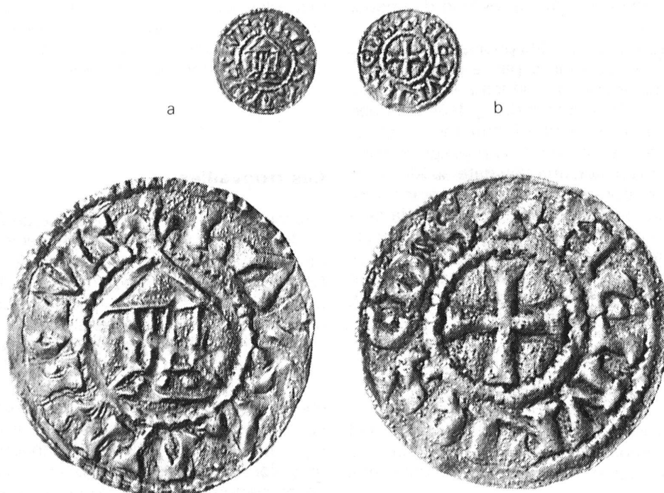
Fig.2 Vallon: monnaie d'Henri, a) avers, b) revers, 1:1 et 3:1