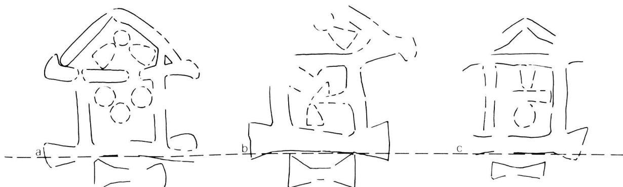
Fig. 4 Temple carolingien sur trois monnaies de Corcelles, atelier de Mayence (Mainz), a) n o 246, b) n o 309, c) n o 312, 5:1

Pour Spire (Speyer) , trouvaille de Corcelles, n o 696, 698, 795 (fig. 6a, b, c), par exemple; nous constatons les mêmes généralités que pour Mayence et Worms.