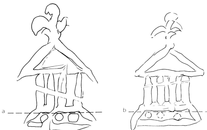
Fig. 3 Temple carolingien sur les pièces d'Henri, a) Vallon, b) Berlens, 5:1

gie de style pour l'avvers des pièces, avec des distinctions pour le revers et la morphologie générale.