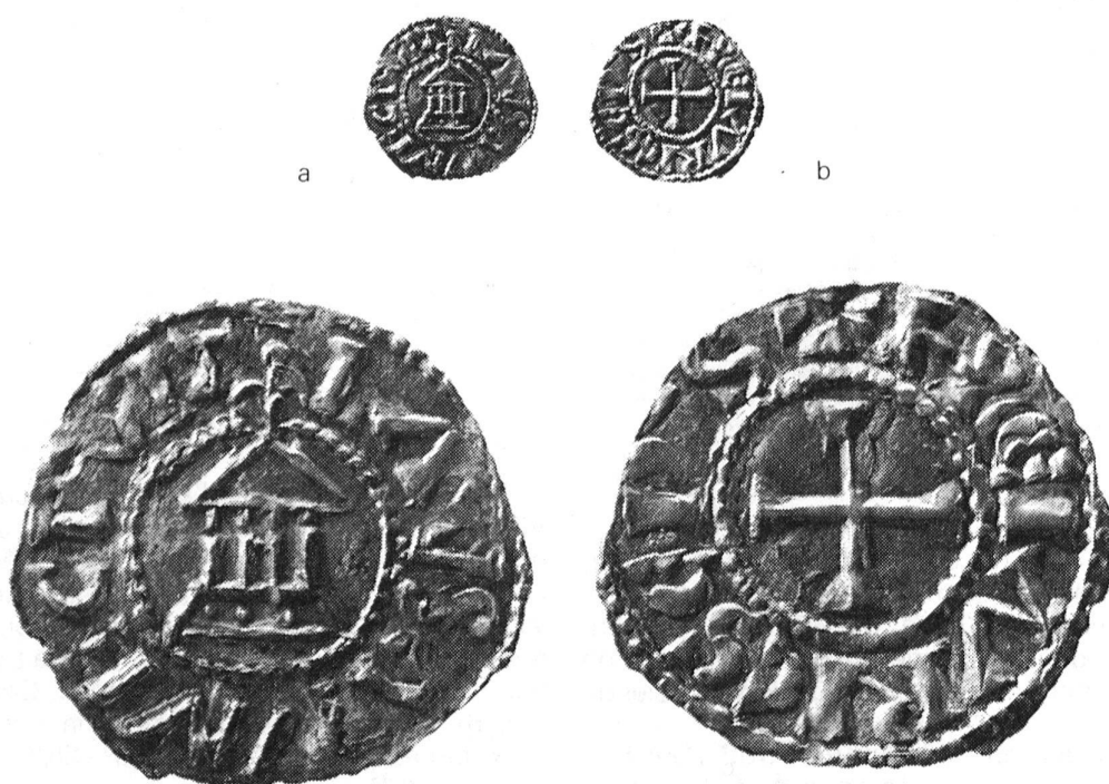
Fig.1 Berlens: monnaie d'Henri, a) avers, b) revers, 1:1 et 3:1