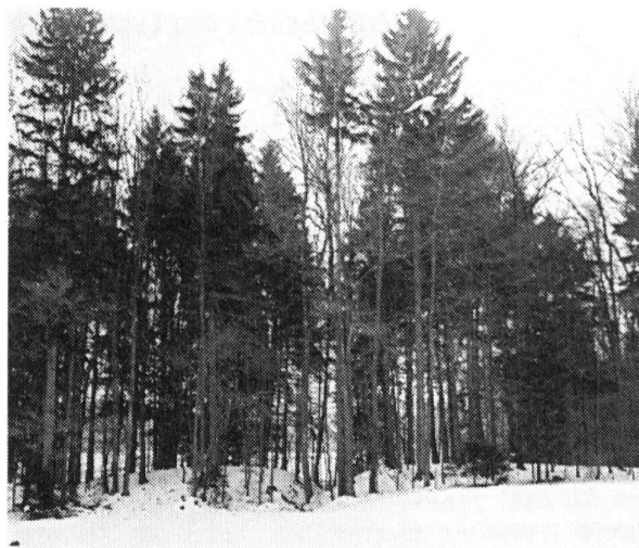
Abb. 96 St. Antoni . Wallaufschüttung von Norden (vorne mitte)