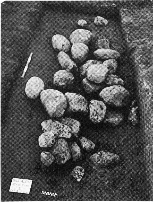
Fig.94 Gurmels. Steinschüttung in lehmigem Torf