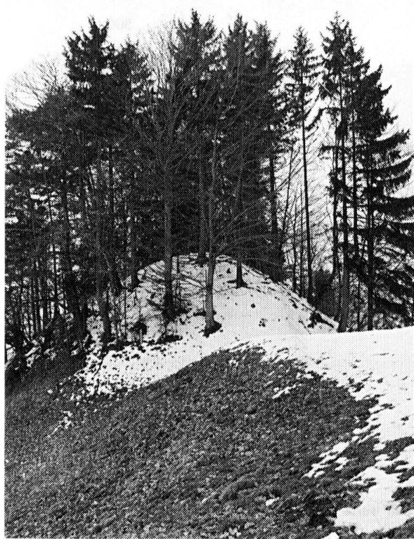
Fig.95 La Roche. Petit refuge ou poste de guet photographié de l'est