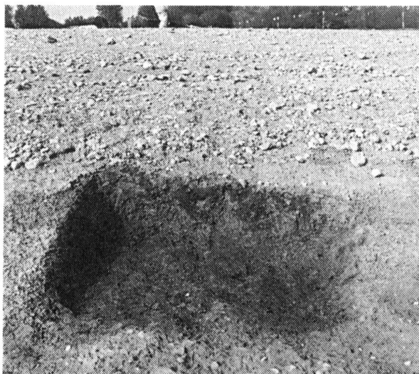
Fig.92 Gumefens. Fosse vidée

Une petite fosse de forme subrectangulaire, de 1,3 × 0,9 m, dont les contours en surface étaient nettement marqués par une ligne de terre rubéfiée (fig. 92 et 93) a été repérée sur un terrain en pente, au bord du lac de Gruyère, en période de basses eaux. Dans le remplissage de cette fosse, très érodée en surface (elle n'avait plus que 0,3 m de profondeur), on releva la présence de nombreux charbons de bois, d'une petite scorie, d'un fragment d'os brûlé ainsi que d'un tesson d'aspect protohistorique. Une couche de cendres assez dense reposait sur le fond. La base et les parois de la fosse, de couleur brun-rouge, avaient été durcies par le feu.