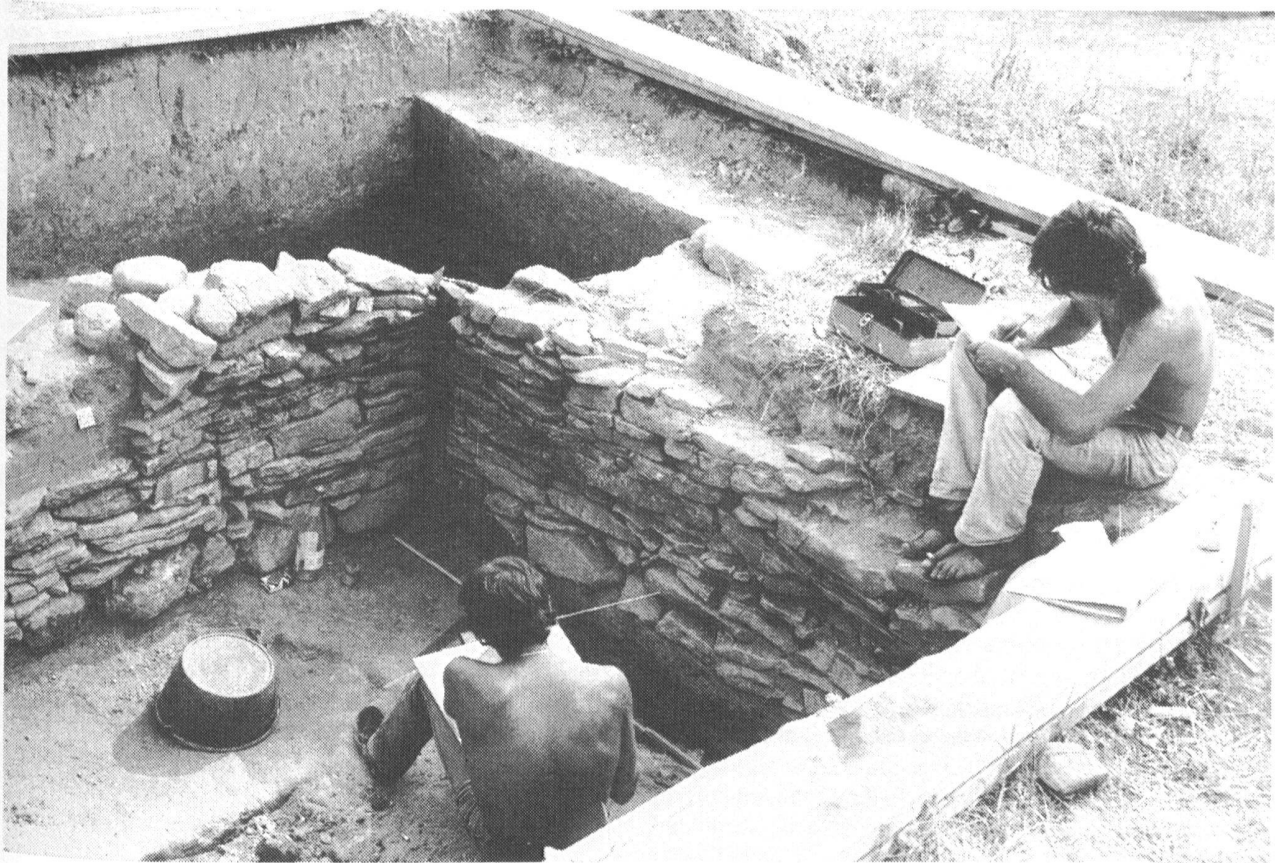
Fig. 22 Mont-Vully. Le parement interne du rempart et le mur sud de la « casemate ».