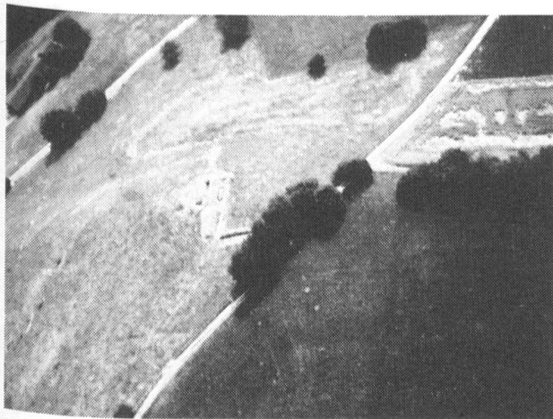
Fig. 23 Mont-Vully. Vue de la fortification en direction de l'ouest.

La fouille, d'envergure limitée, s'est concentrée sur la poursuite du sondage de 1981 qui avait permis d'étudier le mode de construction du rempart de la fin de La Tène (fin du II e –I er s. av. J.-C.) barrant l'accès de l'oppidum du Mont-Vully.