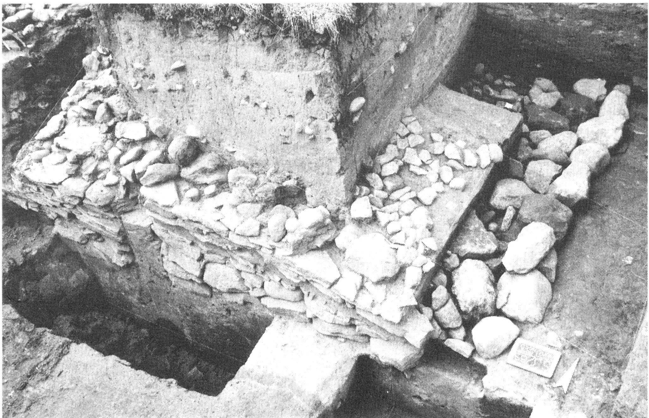
Fig. 21 Mont-Vully. Le pied de la rampe et le mur nord de la «casemate».

Bei Grangeneuve liegt über der Saane ebenfalls eine Befestigung, die der Zeit der Helvetier angehören könnte. Die Entdeckung einer latènezeitlichen Lanzen spitze im Innern der Befestigungsanlage, könnte eine erste Bestätigung für diese Annahme sein.