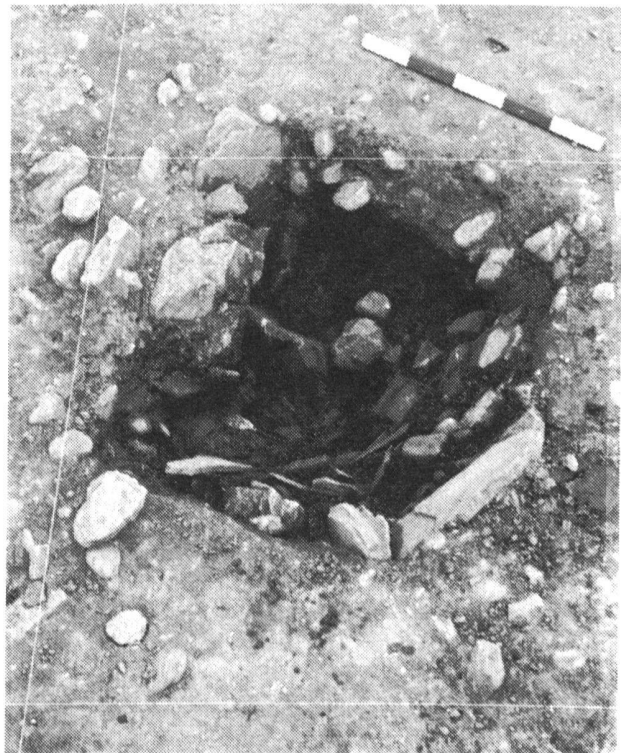
Abb. 14 Murten. Kleine Grube.

Beim Absuchen der Randzonen einer großen torfigen und runden Senke im Nordosten von Blessonney, entdeckten wir im Frühjahr 1983 in einem zur gleichen Parzelle gehörenden Feld zwei Molasseplatten. Diese Platten waren ungefähr 60 cm lang und 40 cm breit. Die Oberkante der ersten senkrecht im Boden steckenden Platte überragte die Oberfläche des Feldes, die zweite lag waagrecht am Boden und war ganz eindeutig durch den Pflug in ihrer ursprünglichen Lage gestört worden. In der Folge hat der Landwirt, der das Feld bewirtschaftet, die beiden Molasseplatten entfernt und für die Sanierung eines Silos verwendet.