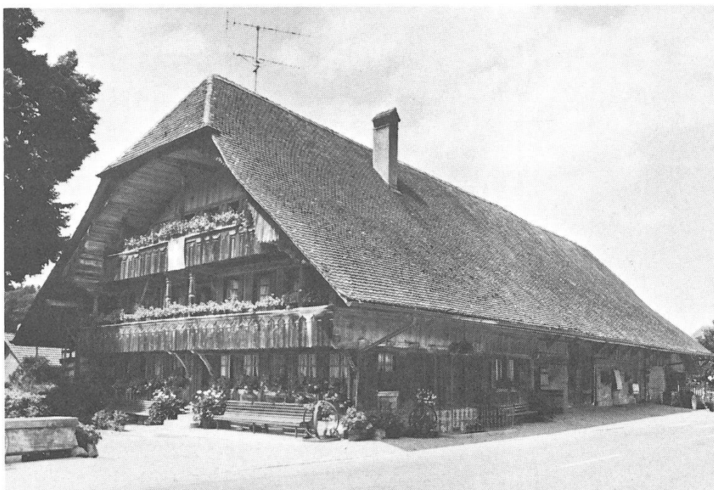
Schmitt, Bauernhaus, um 1800. Giebelfront mit Bogen und Doppelhaus

Firma Peyer & Wippliger, Einsiedeln, 1933; über dem Tabernakel kleiner Baldachin mit Kruzifix, seitlich 2 vergoldete Reliefs mit den Opfern von Abraham und Melchisedek und Ädikulen mit Statuen der Hl. Othmar und Joseph. Ausgezeichneter Chorbogenkruzifix 2. V. 16. Jh. Neugot. Kanzel aus der Bauzeit. Guter neuroman. Leuchter. – Vier Glocken von Rüetschi, Aarau, 1955. – Im Dorf Bauernhaus Nr. 8 , um 1800. Ganz durchfensterte Giebelfront mit Bogen und Doppellaube, Säulen und holzgenageltem Tennortor. Eine der schönsten Bauernhausfassaden des Kantons. – Graben . Speicher Nr. 29, von den Zimmermeistern Gebrüder Aeby, dat. 1791/1808.