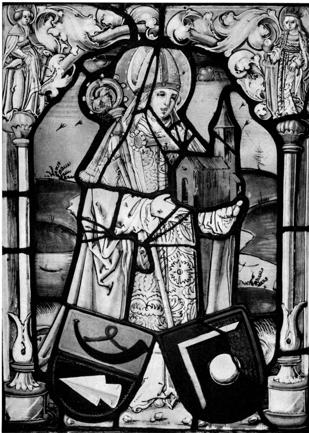
Hl. Wolfgang, Glasscheibe aus der Werkstatt des Rudolf Räschi 1517; leider ist diese Scheibe im vorigen Jahrhundert ins Museum nach Freiburg gebracht worden. Dieses Bild wurde gütigerweise von Herrn Chorherr Josef Schafer zur Verfügung gestellt. Foto Benedikt Rast