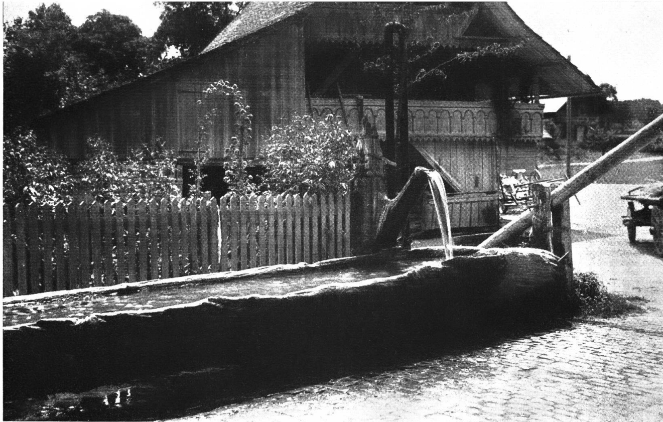
Alter Brunnen in Jetschwil.