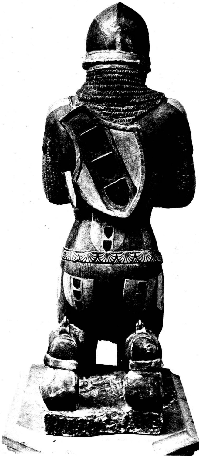
Porträtstatue des Ritters Hüglin v. Schönegg um 1369 in der St. Theobaldskapelle zu St. Leonhard in Basel.