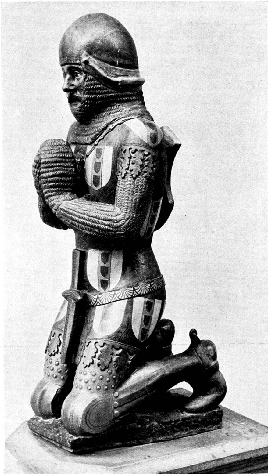
Porträtstatue des Ritters Hüglin v. Schönegg um 1369 in der St. Theobaldskapelle zu St. Leonhard in Basel.