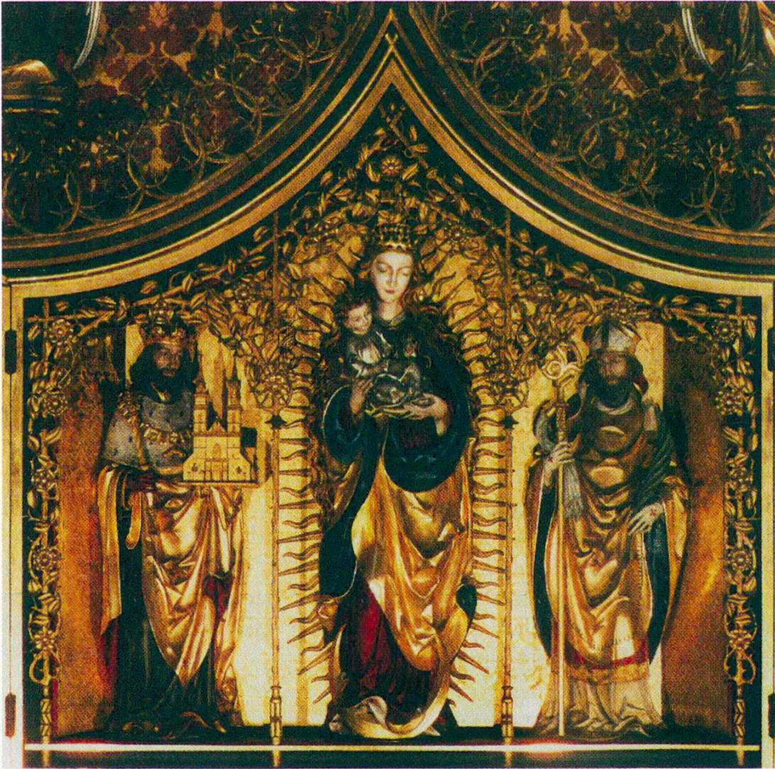
Abb. 6. Joseph Dettlinger (Freiburg i. Br.), Marienaltar im linken Seitenschiff der Heiliggeistkirche, Basel, 1913: Mittelschrein mit den Bistumsheiligen Heinrich, Maria und Pantalus (Aufnahme aus: 75 Jahre Heiliggeist Basel 1912–1987, hrsg. von der Pfarrei Heiliggeist, Basel 1987, S. 36)

«Entfestigung» der Stadt, durch welche sich das Erscheinungsbild Basels innerhalb weniger Jahrzehnte von einer ummauerten, in ihren Strukturen noch weitgehend mittelalterlichen Stadt zu einem unübersichtlichen grossstädtischen Ballungsraum wandelte. Parallel dazu veränderte sich auch das Geschichtsdenken, indem nun dem eidgenössischen Gründungsmythos sowie den «hauptsächlichen Schweizer Schlachten» 185 wieder grösseres Gewicht beigemessen wurde.