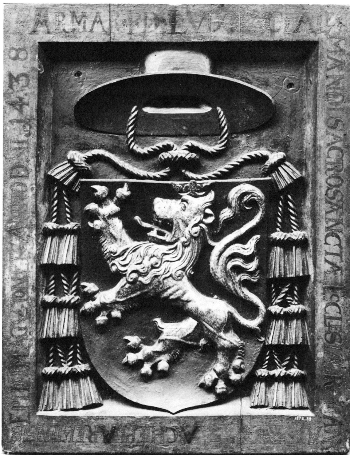
Totenschild des Kardinals Ludwig Alleman, Erzbischof von Arles und Präsident des Basler Konzils, gestorben 1438. Holz, bemalt. Depositum der HAG im Historischen Museum Basel.