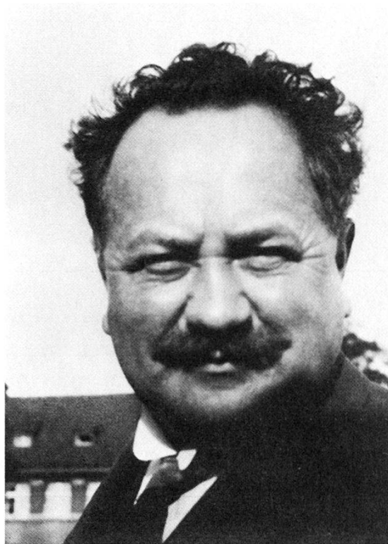
Emil Dürr (1883–1934)