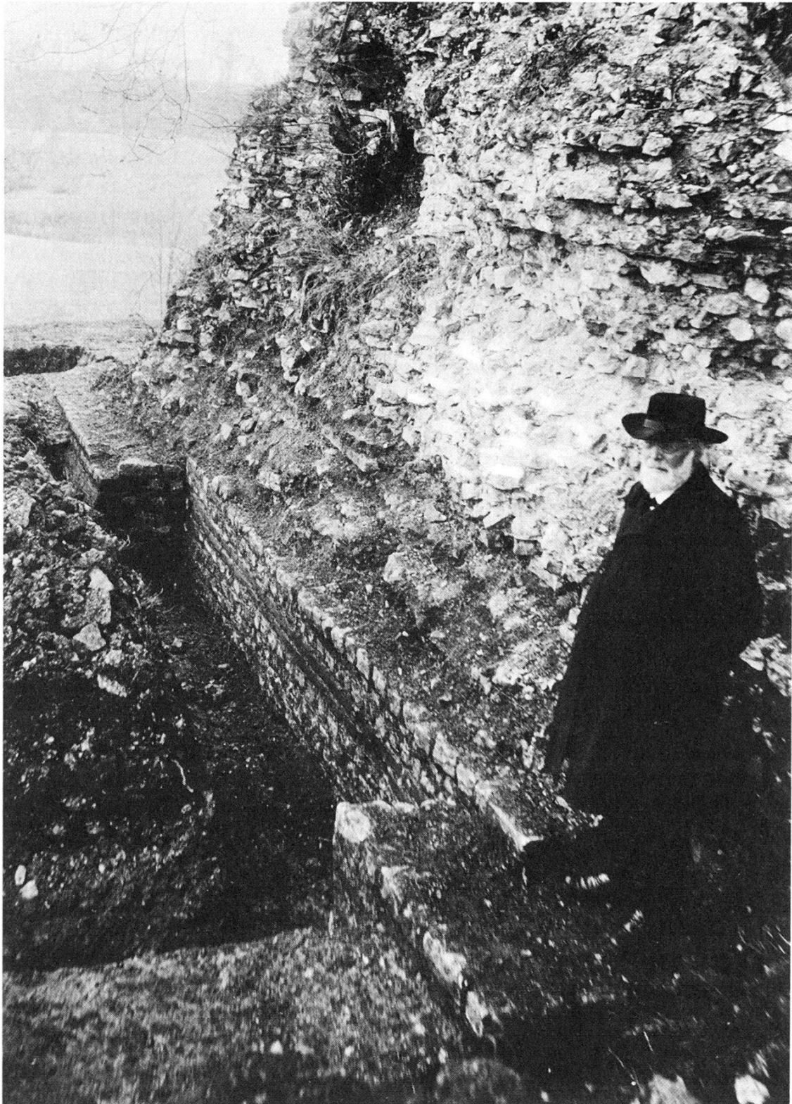
Theophil Burckhardt-Biedermann (1840–1914) in den Ruinen von Augst, 1908