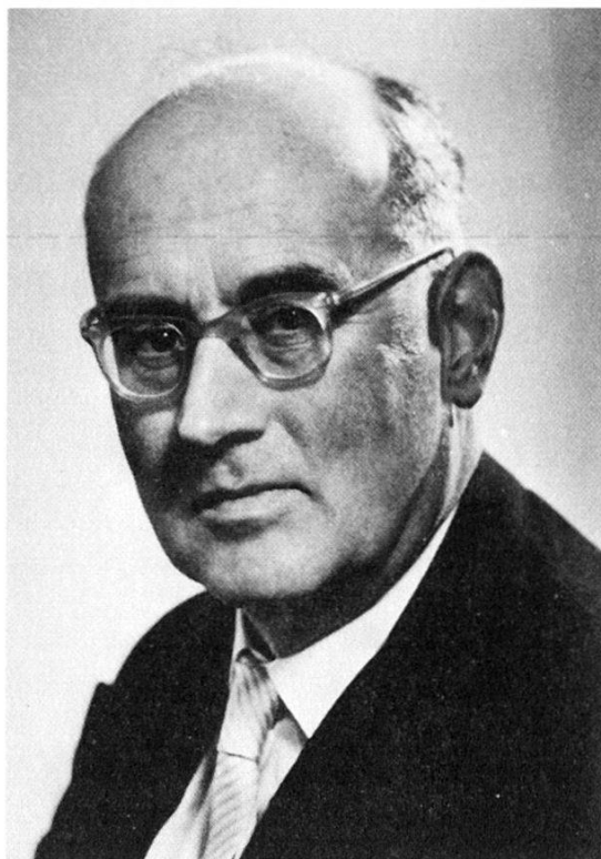
Rudolf Laur-Belart (1898–1972)