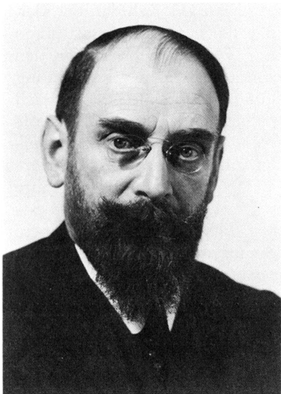
Carl Roth (1880–1940)