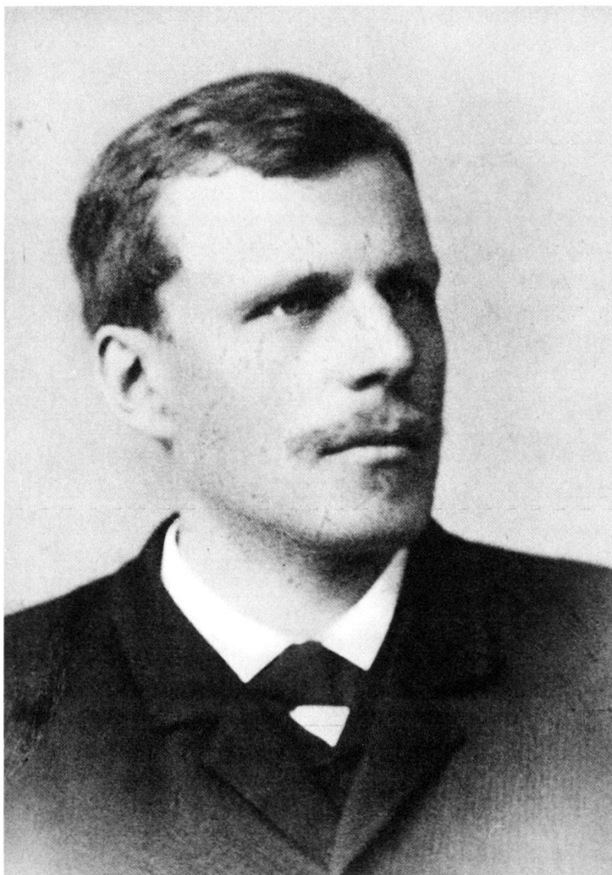
Rudolf Wackernagel (1855–1925)