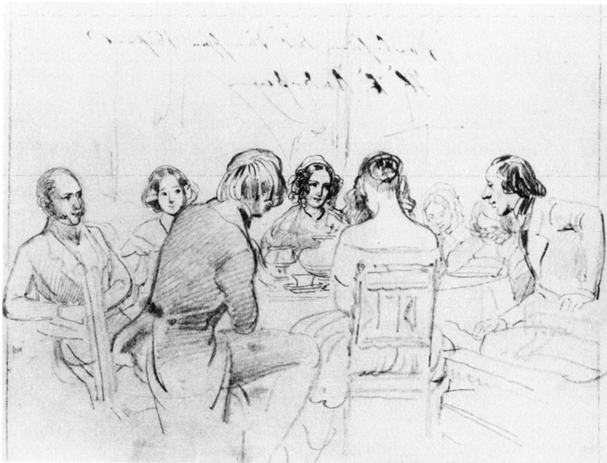
Abb. 3. Hartmann, Steffensen und H.C. Andersen Augustenburg 1845. Museum Frederiksborg A 5357