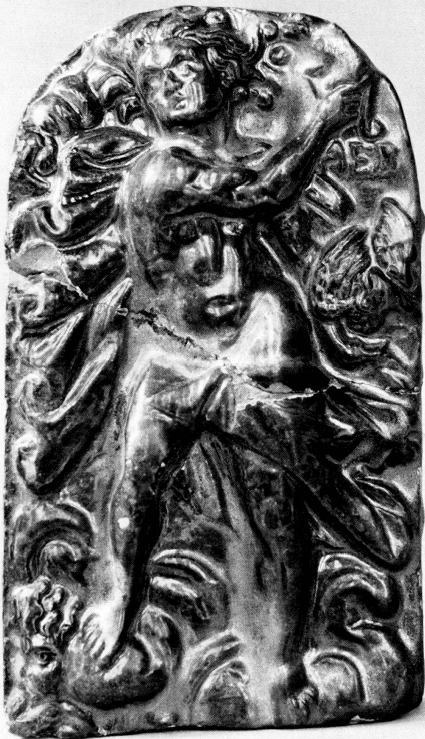
Taf. 1. Ofenkachel aus dem Grabenschutt, allegorische Darstellung der Luft (aer), etwas verkleinert.