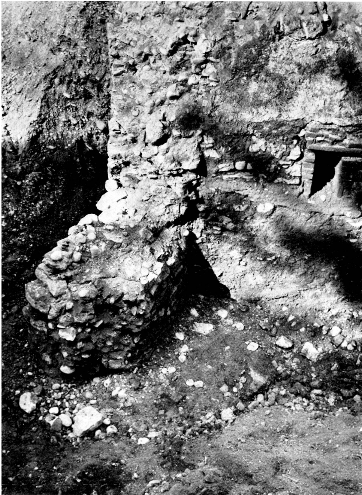
Taf. 2. Reste der Stadtmauer aus dem 13. Jahrhundert mit den Fundamenten des vorspringenden Schalenturmes.