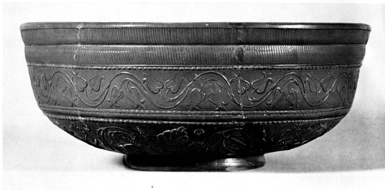
Taf. 2, 1. Schüssel aus Terra Sigillata, Form Dragendorff 29 mit Stempel des Gabianus. Aus Grube 2.