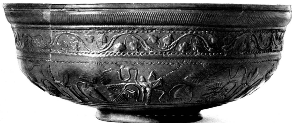
Taf. 2, 2. Schüssel aus Terra Sigillata, Form Dragendorff 29. Aus Grube 2.