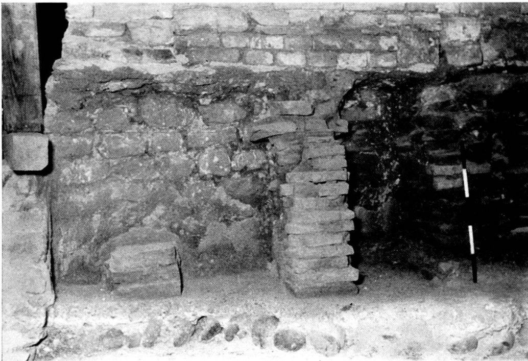
Taf. 1, 2. Nordwand des Hypokausten mit aufgesetzter mittelalterlicher Mauer.