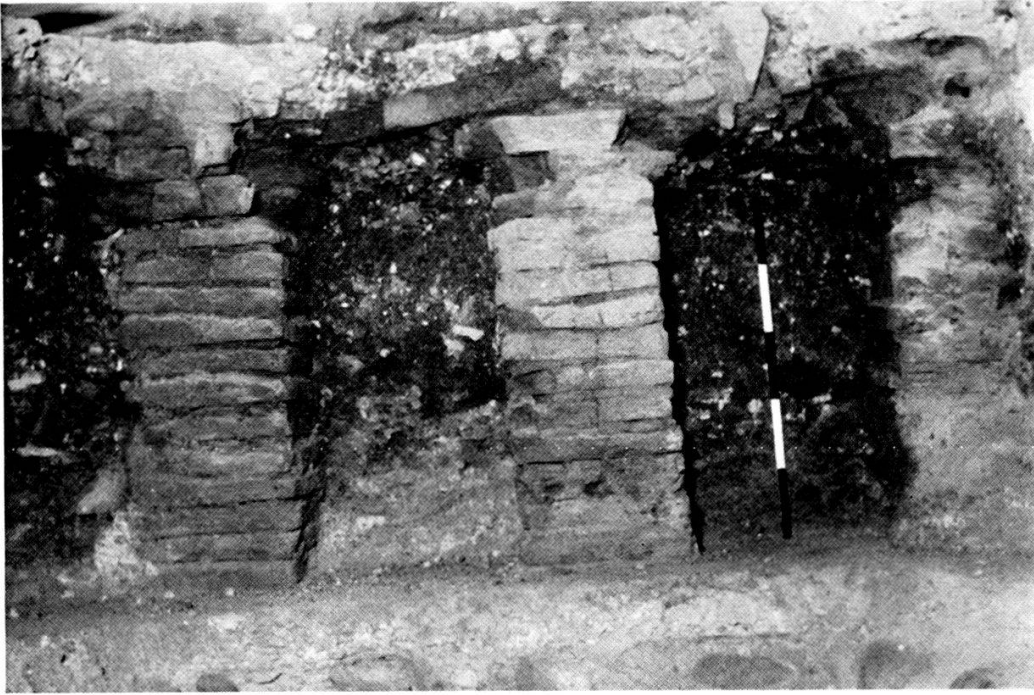
Taf. 1, 1. Hypokaust in Raum B des römischen Gebäudes unter dem Antistitium. Blick auf die Osthälfte.