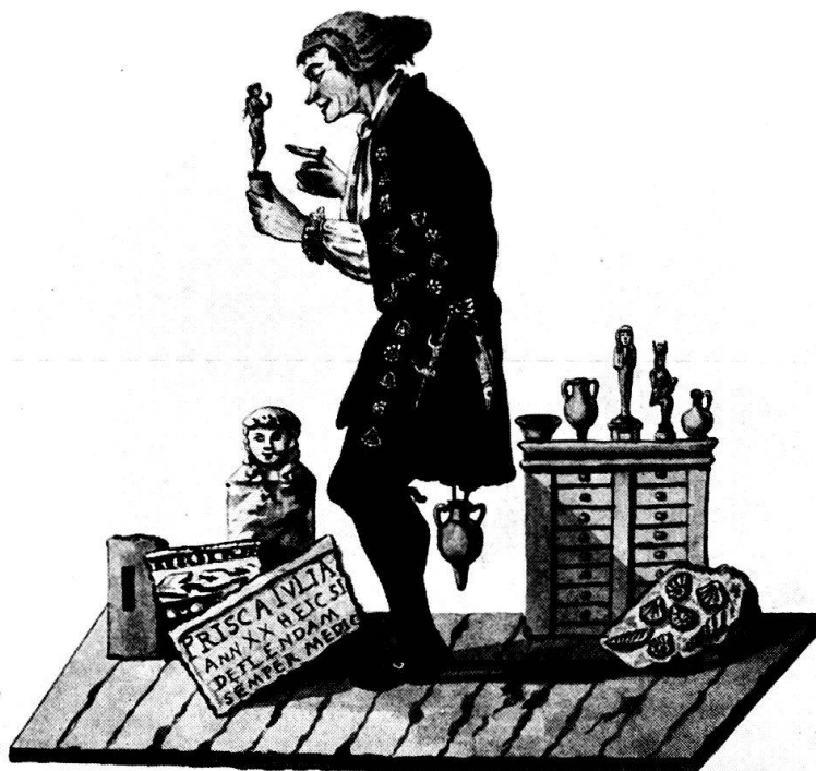
Abb. 2: Karikatur von Prof. J. J. d'Annone, gezeichnet von D. Burckhardt-Wildt.

(Unter der Zeichnung steht in kleiner Schrift der Fundortvermerk «Augusta Rauracorum».)