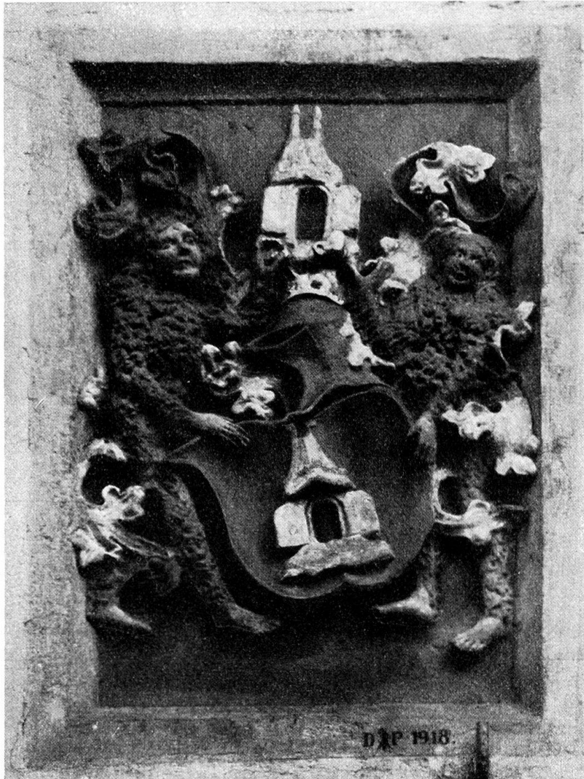
Steingehauenes Wappen am Offenburgerhof.