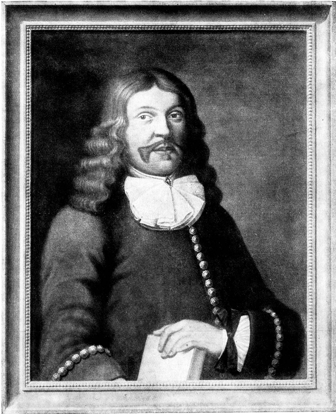
Heinrich Koch. Um 1650.