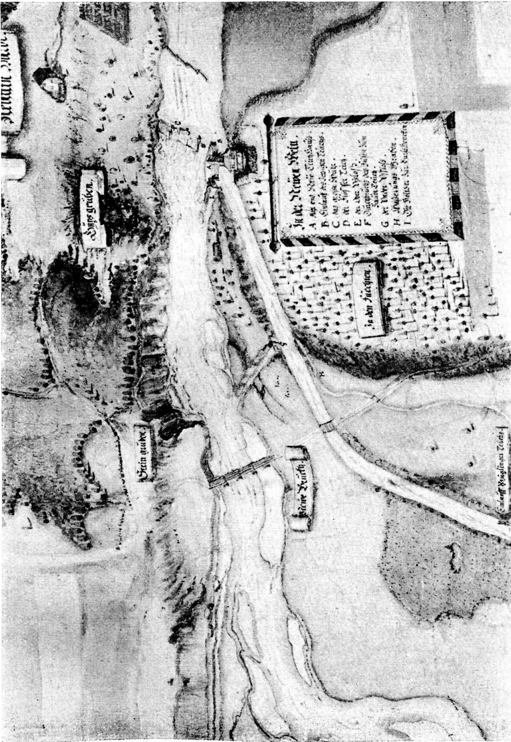
Ausschnitt aus dem Plan von Lohnherr J. Meyer. Oktober 1657.