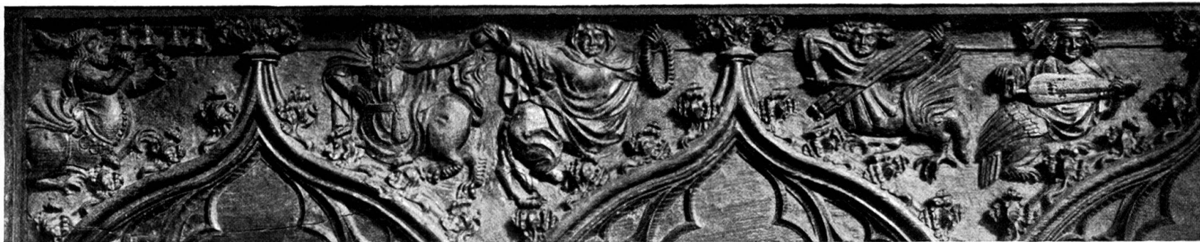
A. Stephanscapelle, links.