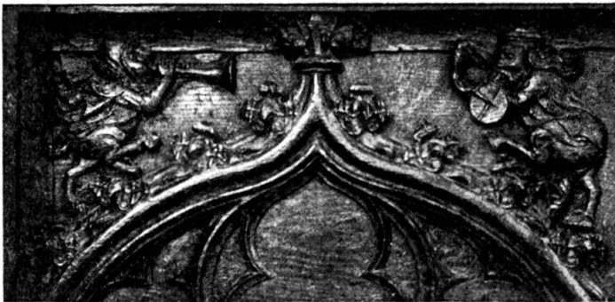
B. Galluscapelle, Mitte.