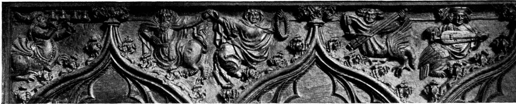
A. Stephanscapelle, links.