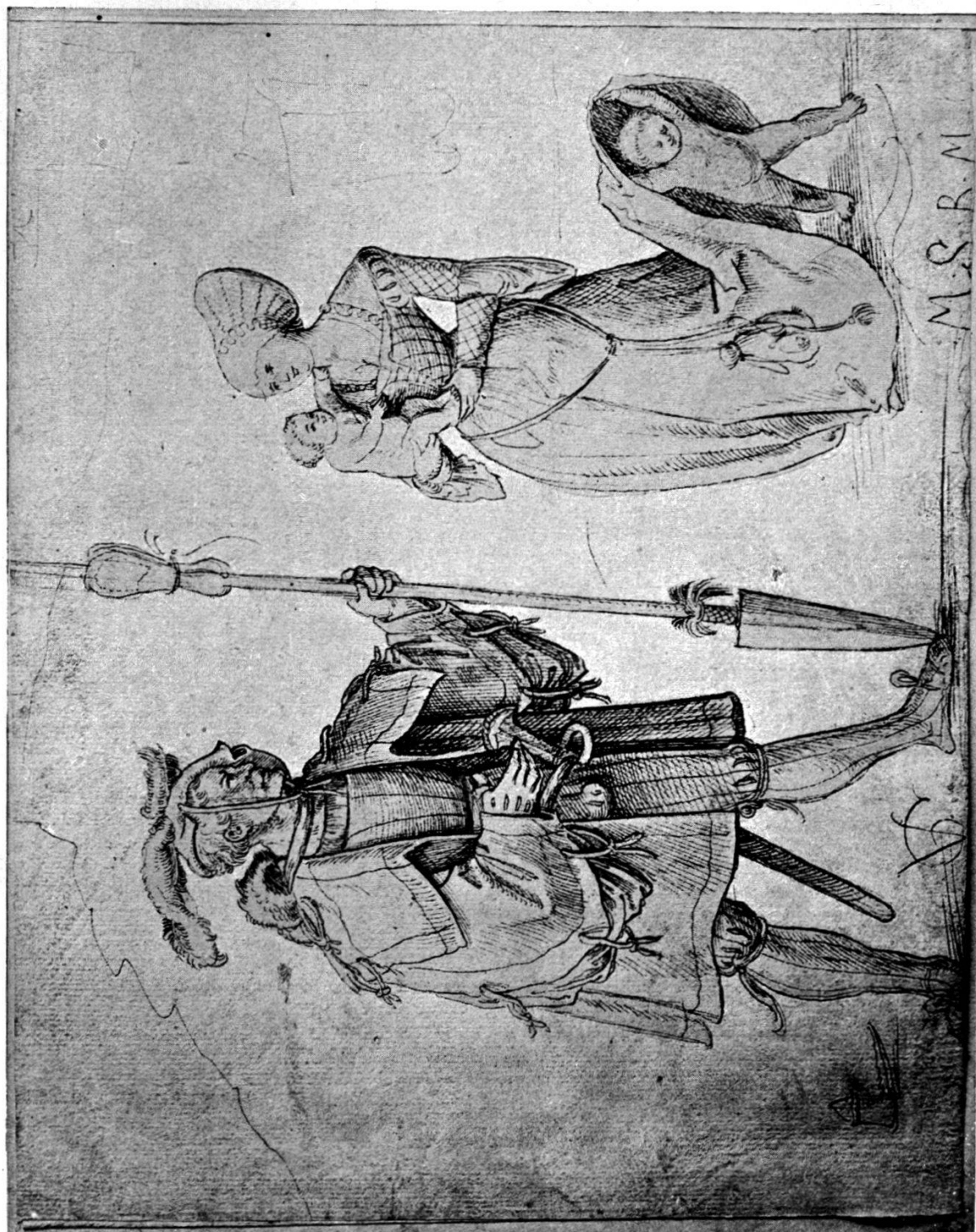
TAFEL III. Urs Graf mit Gattin und Kind, Handzeichnung von Urs Graf 1512.